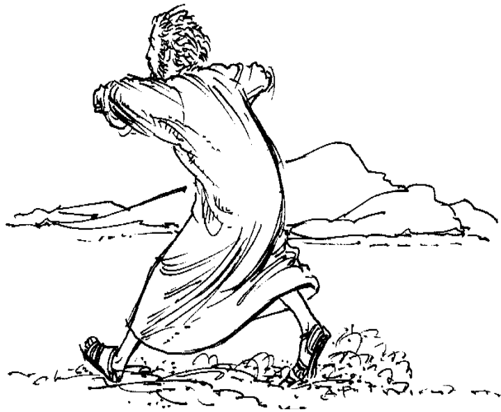
Ju Jonás ats'alhni ju Dios

Ju lacalaslaját sok tamacha la'ixmacni ju Jonás. Pus ju ali'in tasacmilhch tijuch ju