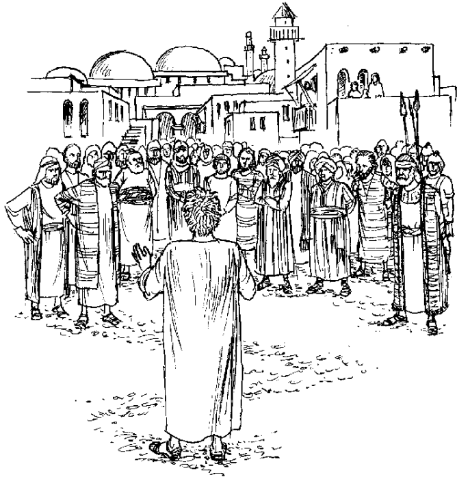
Ju Jonás alacjuni ixchivinti Dios ju amachak'an Nínive

amachak'an tajunita chai na alactu'unin tajunita.