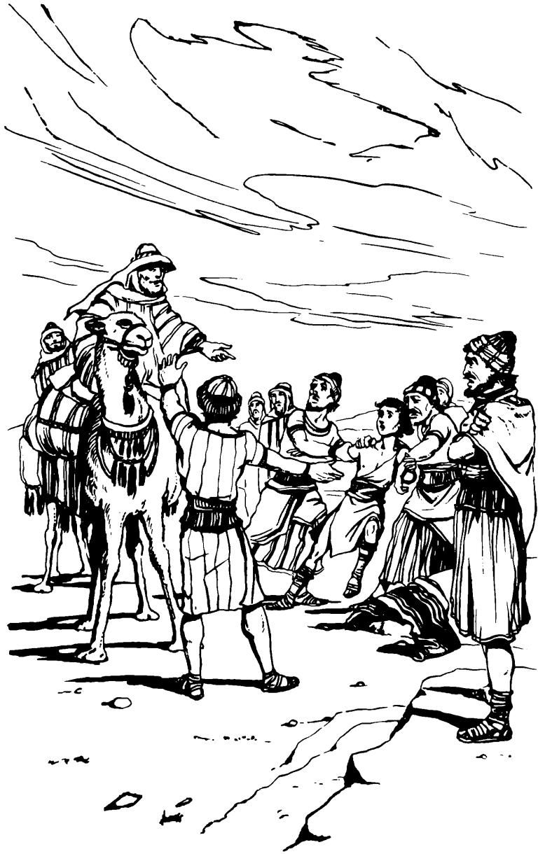
Josere vendieni senjohuë