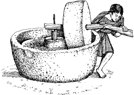
V̀nyò-kpǒ ùzù ka karí ònà ádrùngbǎ ibhu-ba (14.19)

17 Ngàtsi màlàyikà náadù àhu òrù-akpà ò aríí Kàgàwà bhà idza ò rò, ndì mà átò ndàdù ìí inga ǒ dhu ògu ka karí nǐ ndì nakàní obhi nà fóná. 18 Ngàtsi màlàyikà níí ìí ádrùngbǎnga tó obi nà màzàbahù-dǒ aríí kàzù dǒ m . Ní ndi-tsí náahù ndi màzàbahù dǒ rò, ndàdù òkù orú tǔna nyú nà wò atdíǒ ndì nàkà obhi ríí fóná màlàyikà tò. Kàti: «Ídyì wò atdíǒ ndì nàkà p̀b̀ùk̀ù obhi, nyazè yà adzi ǒ ríí v̀nyò-kpǒ nǐ, iwà ndi v̀nyò-kpǒ nǒ'ò nídhuní.» 19 Ní, wò màlàyikà nùudà p̀b̀ìndà obhi yà adzi dǒ, ndàzè yà adzi ǒ v̀nyò-kpǒ nǐ, ndàdù ndi v̀nyò-kpǒ àwà kùzù ka karí ònà ádrùngbǎ ibhu-ba ò. Kǒkò dhu kóró rítèna dhu ní Kàgàwà bhà nàwí. 20 Ka kaha ndi v̀nyò-kpǒ bhùna ò, irinǎ rò kigò tò. Ní, azu n isòlò ndi abho nyú ndi kà-bhu ò rò, gùgùna rùpò, ndàrà àhu m̀h̀àg̀ù-tsù rǒ nyú. Ndirò, ndi azu adù òkù, ndàrà àhu mbèm̀b̀è ìbhu miyà kilòm̀èt̀èrè tí o .