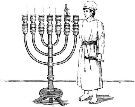
Àrùbhù ɔpbína dǎ ka karí tarà ùlǐ dhu (1.12)

Yēsù rí Yùwanì àvì rándì bhàrùwà Èfesò tó kigò ð rǐrì kànìsà tò dhu (Kas 20.17,28-31 ; Èfe 1.15-16 ; 5.2 ; Èbr 6.10-12)