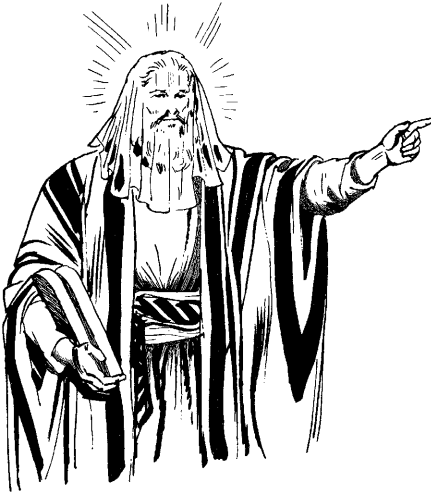
(2 Koríntios 3.6)

4 Kris 2 tu 3 jah 1 la 2 ā 3 nū 2 kxi 2 sxā 3 yxau 2 sa 2 tē 3 sī 1 na 1 ha 2 kxai 3 Txa 2 wā 1 - sū 3 na 2 yxo 2 i 2 sī 1 na 1 wa 2 . Nxe 3 ha 2 kxai 3 e 3 kxi 1 nx2ta 1 wa 2 . 5 Txa 2 hxi 2 ka 1 na 1 - ju 3 ta 2 yū 3 sa 2 nxa 3 wa 2 .