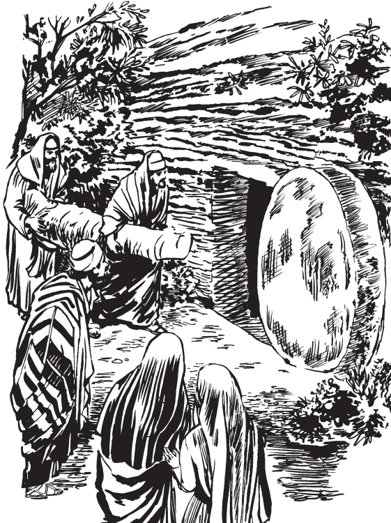
(San Juan 19:40)

José Arimatea pueblolo joome, éhuil Jesústa disciipulotukay jume judíom májhueka, Pilaatotau nookak licenciata áu aahuakä, juka Jesústa takaahua núk sim báreka. Pilaato éntok ä licenciak. Huanäi ä núk siika, juka Jesústa takaahua. 39 Jü Nicodemo, hua bannaataka Jesústau tukaapo nóitekaihui, két áma yepsak, juka mirra éntok áloe náu kütilata huériaka, batte cuarenta kilotukay. 40 Huanärim Jesústa takaahua nüka, sábanampo áa bëtiak perfumeta át huáttiaka, jume judíom kókkolam mamähua, bem ä boojoria pámani. 41 Huerta áma órekay, jum kúrusit ä poponhuakapo. Ímï éntok ánimata