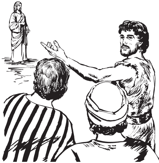
(San Juan 1:29)