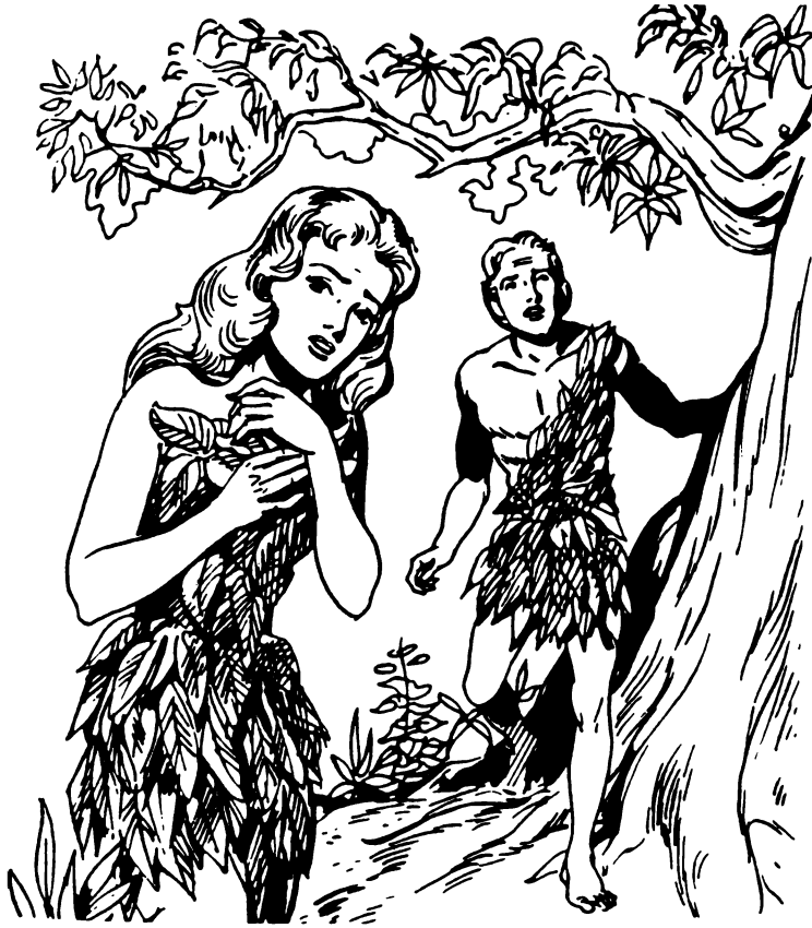
Cahndiin xuta jan tsēhē Nina ( Génesis 3 )

Nixtin hya ne, xihin jan cojo chjuun jan ne, tsajin tsjian yaja me, peru masavaain rē me.