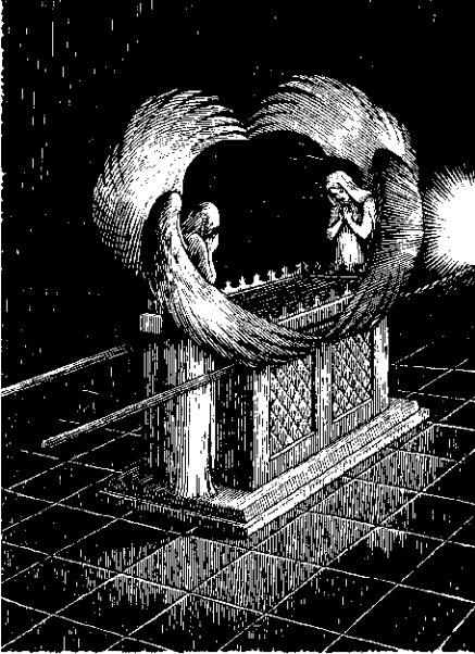
Cajón ne'aj já'asatsja, mpes judiopan yola jis tepyala Dios ca la mijis jupj tjevele jin. (Hebreos 9.4)

ca gente la mijicj. 5 Cajón casá ángel* jin yustapj tjelejeñ, mát'etsja yupj, ne'aj tjelejeñtsja. Oro mpes watsja yupj. Querubines jis latsja yupj. Jis pam jana, la pactsja cajón casá. Querubines mpes, gente salejeptsja Dios já'asatsja yupj jilal. Gente tjowelepj: “Ne'aj Dios perdonar la siji gente malala nyuca la tjajay”. Nun solejé niná popé. Ma quelel pülücj pyac niná mpes; p'a mpes quelel pyac quinam.