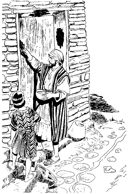
Oveja 'os la t'upj yupj jis wa jun vilicj t'asiyú. (Hebreos 11.28)

32 Napj ca 'ücj mpac gente pülücj sin po'ó, yupj topon wa Dios lal. Nin la cüjay, püs way naya ca cüpac. Mpes ma nin ca mpac tsjan la tjajay yupj pjü way. Gedeón tepyona wa Dios lal, Barac 'ots'ipj, Sansón 'ots'ipj, Jefté 'ots'ipj. David* tepyona wa Dios lal, Samuel 'ots'ipj. Profetapan* topon wa Dios lal. 33 Nenem pjü way topon Dios lal, mpes polel la tjajaytsja Dios tjevele jinwá. Nepénowa la tapalan la p'a nt'a tapatja jilal. Más 'ücj la tapalantsja, mpes jis tjüjütütj tepyala. Nepénowa pajal 'üsüs way jis tjüjütütj la p'a jilal. Dios tjevele nepénowa jilal tsjan ca la mijis yupj mpes, ne nin la tjiji yupj topon mpes. Jepapan la ts'i yupj nepenowá león tjelyawuñ nt'a, león jis la las. León ma polel