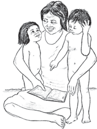
Wam Ximotre 5.10-11

Anhỹr tâ tanhmã hamaxpêr to nē kot amnhĩ jarēnh kwỳm ri axte mjên. Jao te Jejus mã amnhĩ to hêx pyrãk nhũm Tĩrtũm pē jamnuj. Ja pymaj kêr ka mē kormã mē hã amgrà pē 60 kêt xwỳnhjê nhĩxi hã kagà hkêt nē. Kormã mē hã amgrà pē 60 kêt xwỳnhjaja arĩ mē hkĩnh tỳx 13jakamã kot kaj mē kãm mē apkur xà nhõr o apa nhũm mē ja hã amnhĩ tã mē apumu nē axte amnhĩm ãpênh kêt nē. ãm kãm kaga nē htỳx ri nhãm mē hwỳr mra nē nhãm mē hwỳr mra. Nē amnhĩ pumunh mex kêt