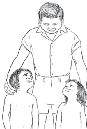
Wam Ximotre 3.4-5