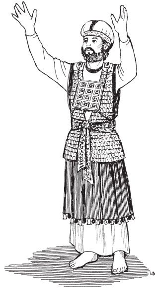
Dub ule'ay nsak ten bexa Israel (Heb. 9:25)

10 1 Le'a ley mke'a Moisés nak cuent dub xi'íntsa be ta wen ilen tso'o wa, ná le'a-yá na'anpa ta ugea ta wen wa. Le'a be men nsa'a be man xnab ndo' Dios itea li'in lak nibe'e ley wa, para le'a ta wa lá yoo gan utsambi'i len lado'o be men na li nkwa'an Dios. 2 Tal le'a ley wa su'u utsambi'i bexa ndo' Dios, le'a bexa yá lá usa'ata be xnab wa ndo' Dios, le'a bexa na'antapa ndap ke ndo' Dios. 3 Ná le'a ta na li nsa'a bexa xnab wa, ta we'e itea li'in ntse'a ladna bexa le'a bexa ndap ke. 4 Le'a ten ten ngon no ten ten chiv lá yoo gan utsu'u be ke ten be men. 5 Ta we'e le'a zha ulen Cristo ndo' gízhliyo ndee, le'a xa lnde'e ndab ndo' Dios: