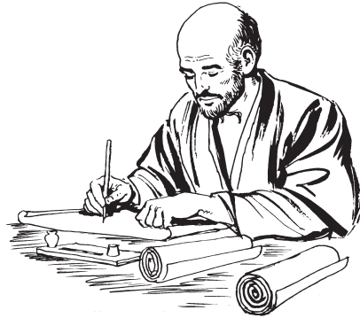
Pabl nsobuke'a dub git ndo' be xmen Cristo ncho gezh Galacia (Ga. 1:2)

8 Ná le'a tal ton gab ndadi'izh xa di'izh wen ten Cristo, para ta nluu xa na'anpa di'izh mbidi'izhla besa ndo' bega, le'a Dios uzhebpa utsaksi xa wa. Guni'i tal le'a dub besa li gudi'izh, natal dub angel nto'o gibe'a li gudi'izh, le'a Dios utsaksika xa. 9 Lakka ndabka besa ndo' bega, le'a na' gáp-a stub biaj: le'a tal ton gudi'izh stub di'izh xa'aga cuent ten Cristo, dub ta na'anpa nak lak nak ta mbingea ladna bega, le'a Dios utsaksika xa wa ta nunk lá idub.