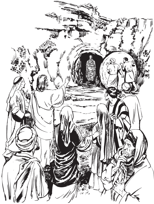
Jesús mbin mban Lázaro ndo' gealgut (Jn. 11:44)

49 Le'a dub bexa wa xa nsalea' Caifás, xa nak ule'ay ndon le'a nsak zha wa. Le'a xa cha ndab ndo' bexa nibe'e wa: