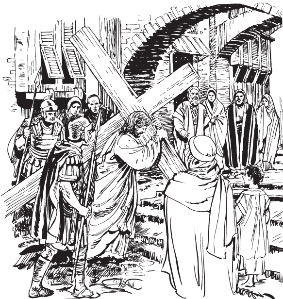
Jesús ncha'ano cruz ten na (Jn. 19:17)

nkeani'i di'izh hebreo no di'izh griego no di'izh latín. Kwa'ad bexa judio uni'í xte'e ndab letr wa, geal le'a sa nkea Jesús ndo'