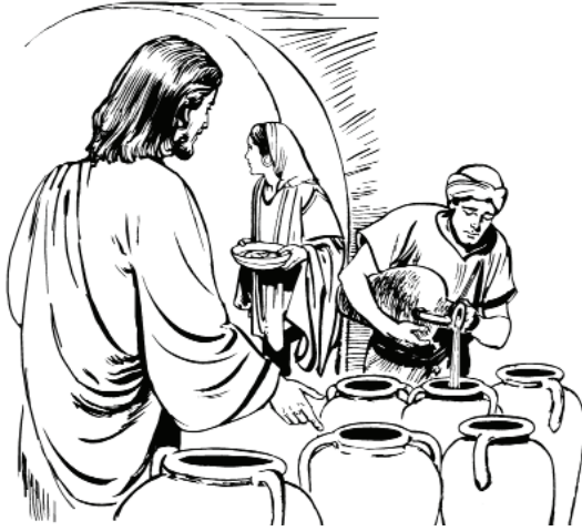
Jesús mbin myak nits vin (Jn. 2:7)

Cha mbi'i bexa-yá. 9 Le'a bexa wa uni'í pa uto'o-yá, parea le'a xa nchansu gast wa gor na mbin xa preb nits myak vin wa, le'a xa lá ini'í pa uto'o-yá. Cha utezh xa xabgi'i mchilya'a wa, 10 cha ndab xa: