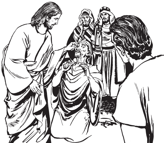
Jesús myunyakna ngusndo' dub xa lá na' (Jn. 9:6)

—Le'a xa nsalea' Jesús wa mbinde'e yalan, cha uda'ab xa-yá ngusndo' na', cha ndab xa gada'ab na' ndo' na' nits Siloé. Ta we'e ngwaa na', no uda'ab na' ndo' na', cha mna' na'.