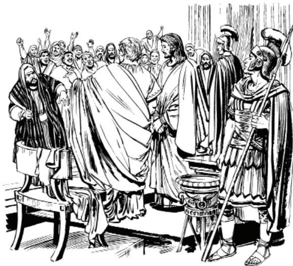
Jesús nso' ndo' Pilat (Jn. 18:29)