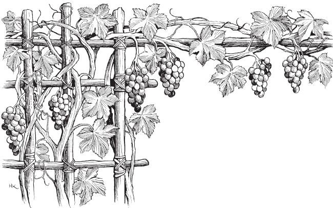
Dub ya uv (Jn. 15:1)

5 Le'a na' cuent ya uv. Le'a bega cuent be xos-a. Tal le'a bega dubtsa nak no na', le'a na' noga dubtsa nak no bega. We'e