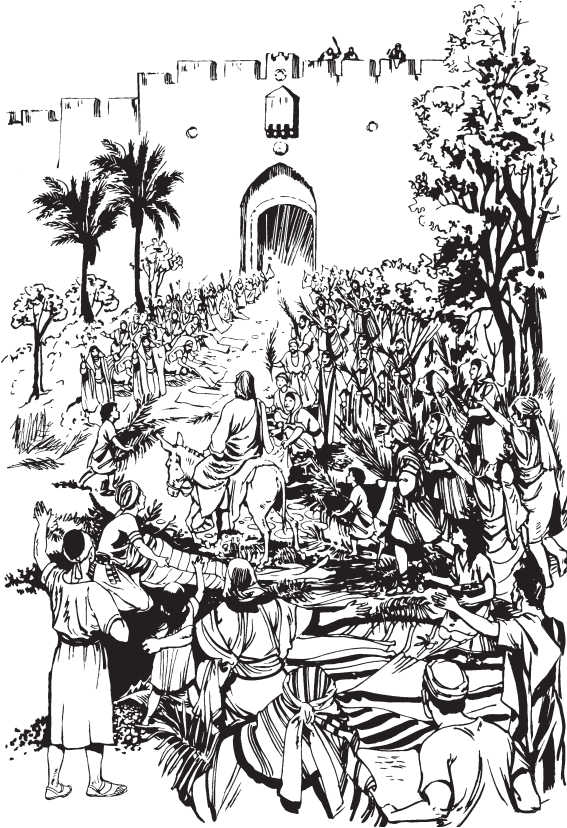
Jesús ncha'yate len gezh Jerusalén (Lc. 19:37)

—¡Dios uzhebpa nla'ach xa nibe'e ba', xa na mtu'ub Dios Xa Nibe'e! ¡Uzhebpa wen yoo be men ndo' Dios gibe'a! ¡Si'il nak Dios nsob ga'ap!