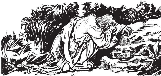
Jesús mbidi'izhno Dios sa nsalea' Getsemaní (Mt. 26:39)

41 Utena' bega no bidi'izhno bega Dios, ndontsa na'anpa