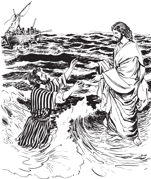
Jesús lá ula'a ngat Pedr len nits (Mt. 14:30)

Le'a Pedr cha ula' ndo' barco nchasea ndats ndo' nits, ncha'a xa wats Jesús. 30 Parea ngol gor uni'í Pedr lita nso' mbi