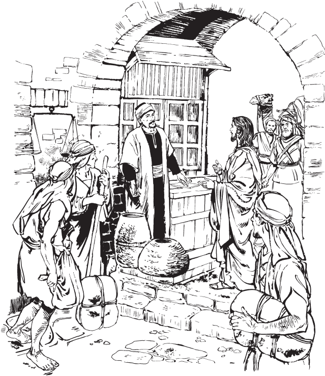
Jesús utezh Mateo (Mt. 9:9)

ndaltezh bexa ngondo' le'a ndapka ke, ndontsa yach bexa wats Dios.