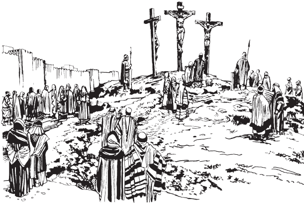
Jesús nkea ndo' cruz (Mt. 27:38)

41 No liga le'a be ule'ay nibe'e no be mech ten ley no bexa fariseo no bexa gox nsak wa ndun usaladno Jesús, ndab bexa ndo' ltsa'a bexa: