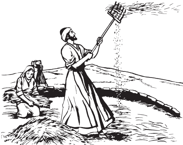
Dub xa ntsambi'i trig (Mt. 3:12)

11 'Le'a na' ndee nits-tsa ngolea' be men, ta nluu le'a bexa mla'aka be ta ugap nak bexa. Parea tso'o na' ilen stub xa kolea' be men no Espíritu ten Dios no gi'. Le'a xa wa mas nsak ndo' na' gast ni lá isaya na' goo na' ndab xa wa. 12 Le'a xa wa listla nso' uti be men wen lat bexa ugap, cuent dub men nti bid ten trig lat be gix xab-a. Cha kocha'aw xa trig wa len ni'i, nsea utso'ol xa xab-a wa ndo' gi' nunk lá yu'u.