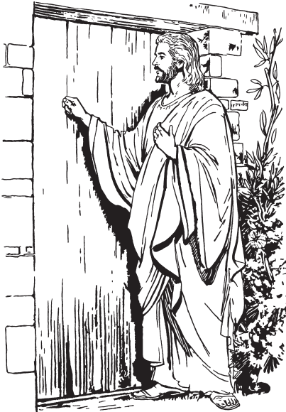
Le Jesus zu ruyaglaa

falt lo de; per no ryenden de ne baanske rzak de, nles rzak de, prob de, ngwlëë de, noze xgyerbëël de. 18 Por neguin yna noo lo de, guka or lo noo, or ne che wruu lo gyi no ne che wyan teblöse or, chen nli gakrik de; no guka lërngyich lo noo gak de, chen yruudet xgyelentu de; no guka rmed lo noo taa bzalo de chen gak kwii de. 19 Noo rakndux noo lo mén por ne ryaan noo men no rlxnëz noo men. Por neguin yna noo lo de, gulaa xdxii noo ydeblextoo de no gusaan xgyelmal de. 20 Gukwii gante, le noo zu ruyaglaa rkarëz noo. Belne nuu mén ron rkarëz noo no belne yxal men yaglaa, tee noo lenxyuu men, guxsëë noo yrup