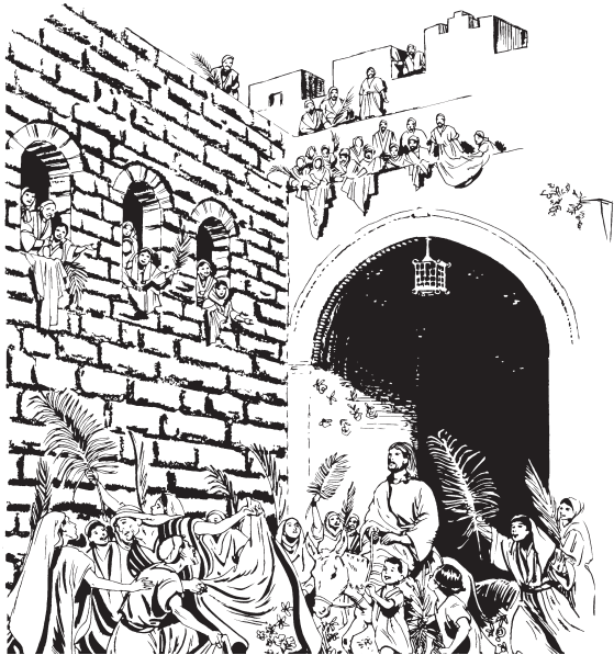
Chene wdxiiin Jesus Jerusalén

6 Wke men re men zegne re Jesus lo men. Orguin wdee yra mén guin si wzano men maa. 7 Wdxinno men ma lo Jesus, wxob men lër ne rrël men led maa, lex wbiib Jesus maa. 8 Ndal mén rgyixnchiil lër nëz, nuuzeg mén rkyiits gyizh rgyix men nëz ledne tee Jesus.