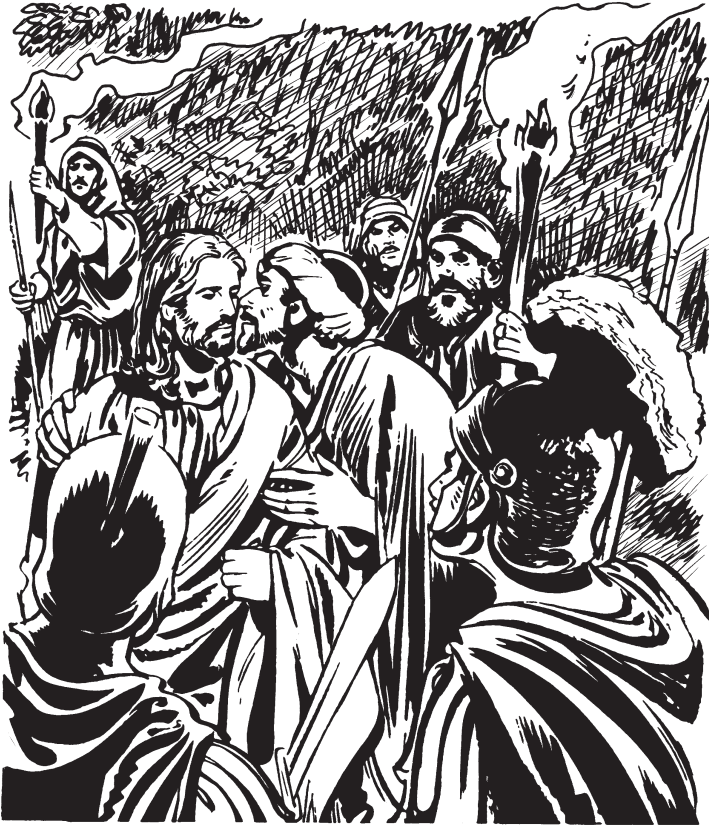
Woo Judas bzhid gyedkwes Jesus

Dëdyuzh wkaneluu noo de yra de, no wnëzdet de noo. Per kayak neree chen gak kumplir yra ne zëed lo xgyiich Dëdyuzh.