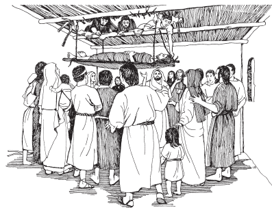
Chene wneseyaken Jesus mgyeey ne noze waknet led

2 1 Chene che wluzh txup tson gbiz, wberree Jesus wdee ke Ne lenlgyëz-Capernaum. Ne waknan mén ne le Ne che ke ka Capernaum, 2 kesentyent ndal mén wdop lo Ne, axtegue rgadet ledne kwiin men; orguin wzëet Ne xdiiz Dëdyuzh lo men. 3 Orke guin wdxiin tap mén nga ledne zu Ne, wdxinneey men te mgyeey ne noze waknet led. 4 Per kom rakdet ydxiin men axtegue lo Ne por tant ndal mén ndxin lenyuu ledne zu Ne, orguin wlis men tebëd tezh led yuu guin; lex nes guin wlit men mengyiz guin ydebxloon men. 5 Ne wii Ne ne rlaleedx yra mén guin Ne, re Ne lo mengyiz guin: —Zhiin, le xdol de che wak perdon.