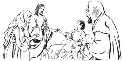
Wneban Jesus xsaap Jairo

—Talita, cumi —diizree rna: Nzaape, yna noo lo de, gutsaxee.