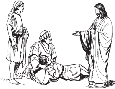
Chene wneseyaken Jesus te mee ne nuu menzab lextoo

axtegue lalre tyemp gun noo de wantar? Gutano me nee.