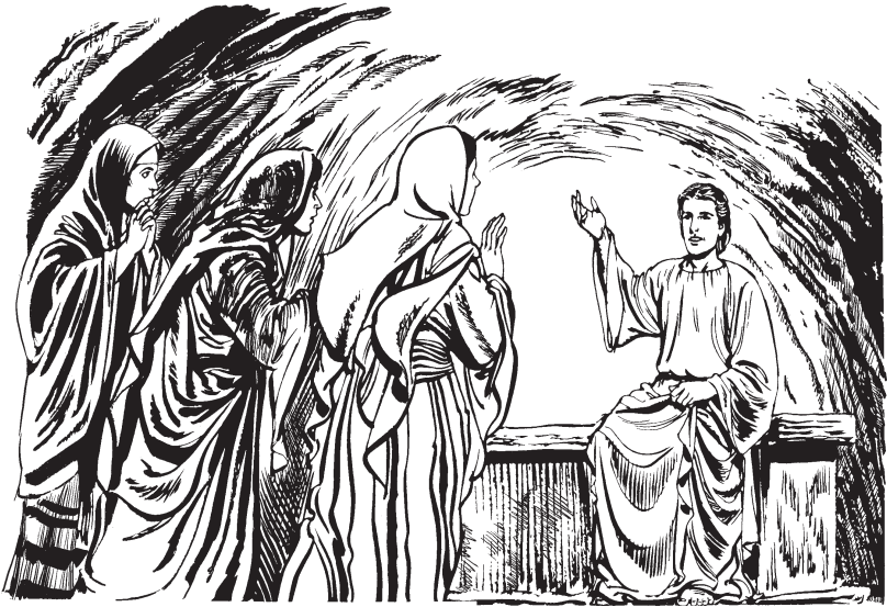
Yëtre Jesus lenbaa

ladbëë. Nak mgyeey guin te lërngyich ne ngool. Wdxe yra wnaa guin. 6 Per re mgyeey guin lo men: