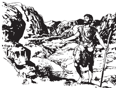
Wa Xwa ne rtxobnis denbidx

rzëet Xwa. Lex rxobdol men, rluzh nga rtxobnis Xwa men rugyow-Jordán.