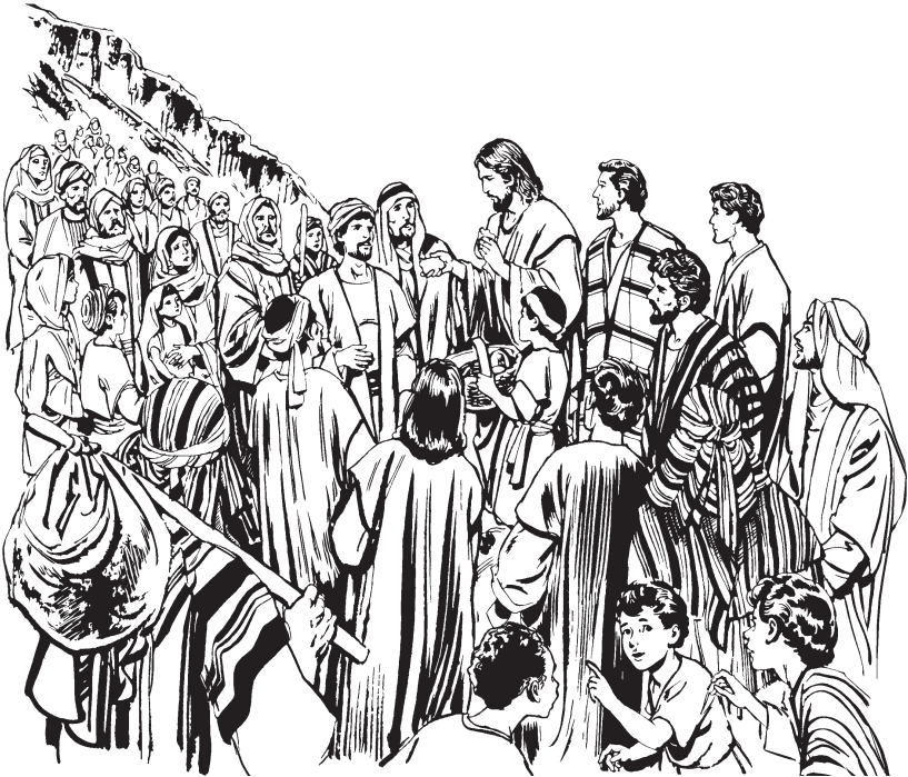
Chene wdee Jesus ne wu gaaymil mén

45 Zhich guin wkyyeen Jesus yra xpén Ne wdee men lenbark chen sanergue men tekaa men stebkoo nis, ydxiin men Bet-saida, myentras ne le Ne guli yra mén guin nëz. 46 Wluzhse wguli Ne yra mén guin nëz, za Ne ledne nak gyeey chen y nab Ne lo Dëdyuzh. 47 Chene wnit lyu, le bark chekke za gwrool nis, le Ne wyan lyubidx tete Ne.