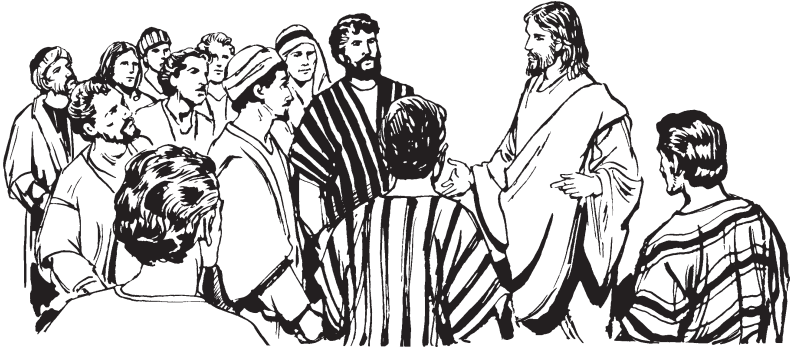
Chene wxaal Jesus yra chibtxup xpén Ne

mén guin axtegue ne yruu de gyéz guin. 12 Zegne tee de lenyuu, ygabtyuzh de yra mén ne nuu yuu guin, gue de lo men: “Gyelendxi wlenza lenyuuree.” 13 Belne neden men gyelendxi guin, por laa men nako, per belne nenden-det meno, por laake de yra de nako. 14 Belne nuu gyéz o yuu ne ylaandet mén kwii men de ni ylaandet men gon men ne rzëet de, yruu de nga, kwib de guxyudi nii de zegnak te beey ne nadet mén guin nyon men ne wzëet de. 15 Nligue yna noo lo de yra de ne chene ydxiin dxe ne ylaa Dëdyuzh gyelextis, ntozdee sakzi yra mengyéz guin ke lo men-Sodoma no ke lo men-Gomorra.