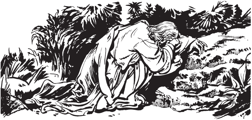
Le Jesus rnab lo Dëdyuzh

—¿Pe ni te or wakdet nzobna de? 41 Gusobna, gunab lo Dëdyuzh chen ysegyeedet Bzelo lextoo de. Rlaan de ylaa de ne wen, per led de rundet gan.