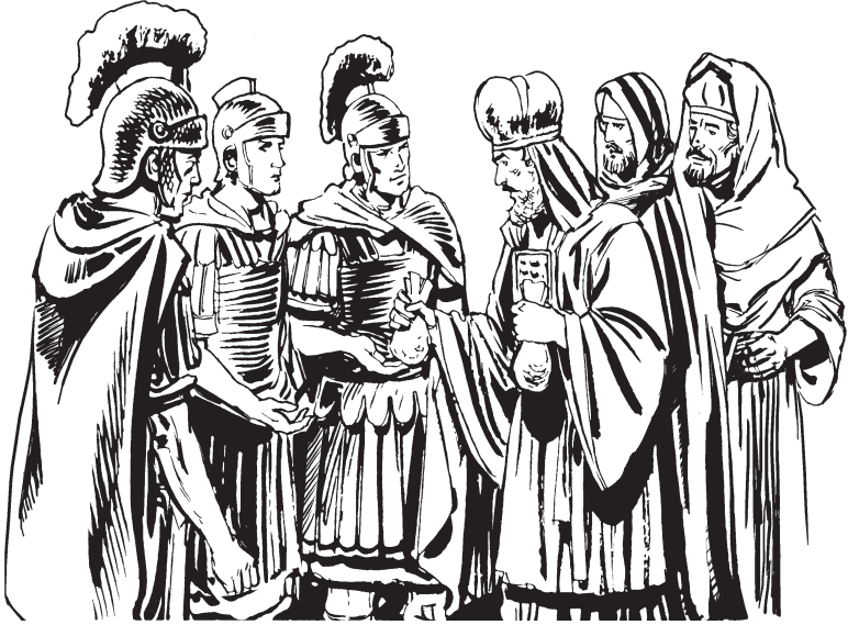
Wdee fxuz med lo soldad

8 Orgueguin wruu yrup wnaa guin rubaa, te rdxe men te rzhiilen men; noze rzhoon men zaluu men diiz lo yra xpén Jesus. 9 Ne za men nëz, wlalo Jesus lo men, wgabtyuzh Ne men. Wbig men wzuzhib men lo Ne, wgyeedx men nii Ne. 10 Lex re Ne lo men: