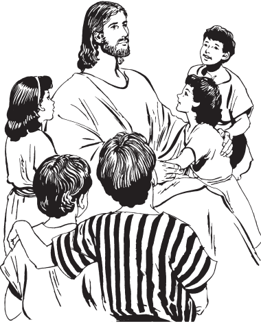
Chene wnaab Jesus lo Dëdyuzh por minwin