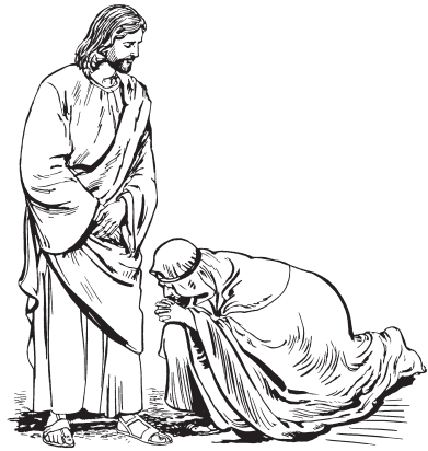
Mén ne wa wzuzhib lo Jesus

16 'Rut rkadaadet tebla lërkweb led te lëryuux, porke rdop lërkweb, lex rtxëzo lëryuux, mazre raknzhoodee ledne wrëz. 17 Ni rgaadet mén binkweb lengyedyuux, porke belne ylaa men zenga, srëz gyedyuux, nigle xiin bin, nigle xiin gyed. Por neguin leen ke gyedkweb taa binkweb, chen zenga ni tebo xiindet.