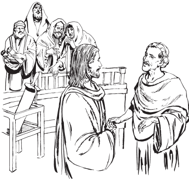
Mgyeey ne wneseyaken Jesus nya

—Belne nuu de te de rap te mēkzhiil, lex gyab ma te leen pos dxe ne rne be, ¿pe tsaloo-detgue de maa? 12 Si nondee te mén ke lo te mēkzhiil. Por neguin zak ylaa me ne wen dxe ne rne me.