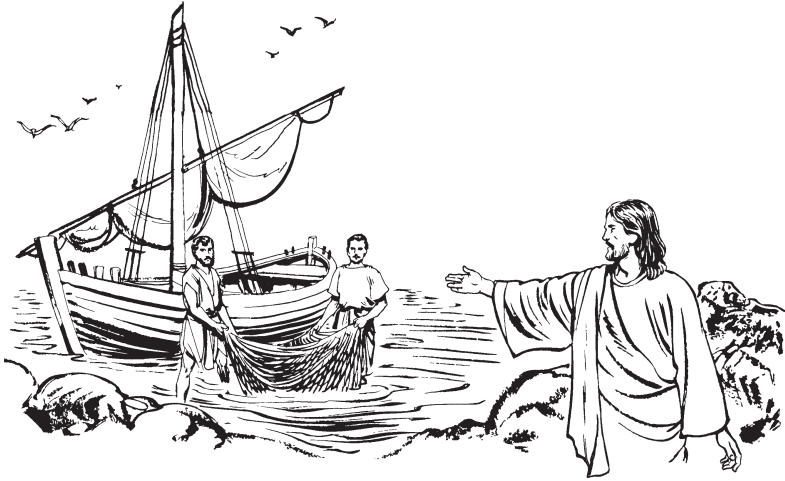
Wbëz Jesus Bëd yrup Bëd Ndrizh

ke Bëd yrup men Ndrizh bech men, katxoon men xgyix men lo nis porke gozmël rkaa men. 19 Lex re Ne lo men: