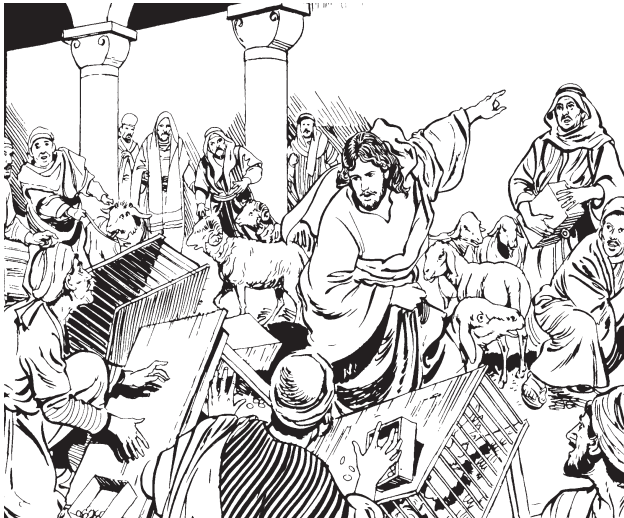
Chene wnexoon Jesus yra mén ne ndxin rtoo ruydoo

—Lo xgyiich Dëdyuzh re: “Xyuu noo, ledne ynab mén lo noo sela we”; per le laa de yra de rlaa do zegnakk xebllu ngbaan.