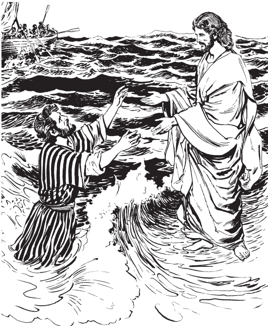
Wzebyët Bëd lo nis

31 Orguin wzegaa Ne nya Ne wnëz Ne nya Bëd, re Ne: