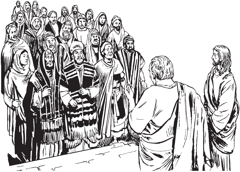
Wnabdiiz Pilato lo yra mén

18 Re Pilato zenga porke wyenen Pilato ne por gyelembidye wdekwent men Jesus.