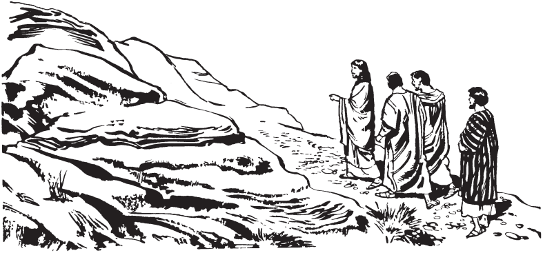
Wano Jesus tson xpén Ne te xtoo gyeey