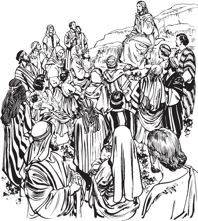
Wneluu Jesus mén te xtoo gyeey