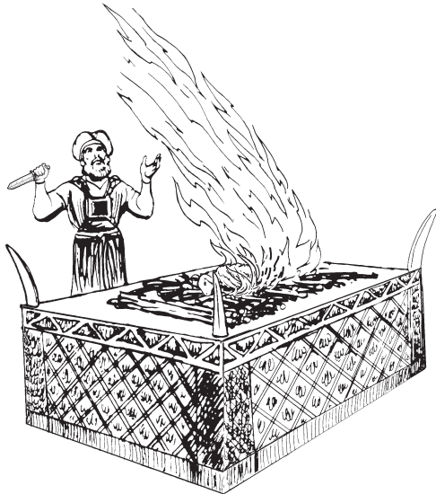
Pipura'ó riyukuna wa'até: Hebreos 2:17, Hebreos 5:1-10

15 Kajmuruna ina'ukena i'imaká ketana, nakero'okó taka'akaje piyá. Nakero'okó piyá taka'akaje piyá aú, Jesucristo taka'arí ina'uké chaya i'imaká. 16 Unká ra'akáloje Tupana wa'atéjema, je'echú chiyájema, ñathé penaje kalé riphá majó i'imaká. Riphá majó, ra'akáloje kaphí Tupana chojé péchuruna. Abraham pechu i'imaká richojé kaphí, ke kaja péchuruna ñathé a'ajé riphá. 17 Ra'akáloje nañathé penaje ri'imá najwa'até ne'ewé ke, ñakele riwe'epí namu'ují. A'awaná apiyákakanami nakojé ritaka'á ina'uké chaya i'imaká, ripalamane aú ramákolaje kaphí richojé péchuruna chaje. Ilé ke la'akana aú rilamá'ata ina'uké Tupánajlo. Puráka'aloji lamá'atajeri ina'uké chaya Tupana wa'até penaje riká. 18 Pu'uaré la'akaná a'arí kaja Jesucristo me'é rijluwa i'imaká, rila'akáloje