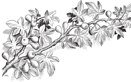
higos, fruto de la higuera

kojno'orí mana'í chiyó. Dieciocho ina'ukena cha rikojno'ó i'imaká, raú nakapichó piyukeja. Apala ipechu nakú i'imá: “Ajopana Jerusalén eyájena chaje ka'ajná nala'ajika pu'uwaré i'imaká, pachá ka'ajná nakapichó”, ke. 5 Numá ijlo unká ripachá kalé nakapichó. Unkájika ee ipajno'otá ipéchuwa pu'uwaré ila'akare liyá, ñaké kaja ikapichájiko —ke Jesús kemaká najló.