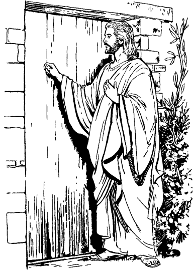
Jesucristo punkuta tocaspan (Apocalipsis 3.20)

noqaqa punkuta tocaspan waqyamushayki. Sichus qan waqyakusqay vozniyta uyarispaykiqa, punkuta kichamuway, wasiykiman haykumunaypaq. Hinaspan noqaqa qanwan cenasaq; saynallataqmi qanpas noqawan kushka cenanki. 21 Diablota venceq runatan noqaqa permitisaq, tiyana *tronoypi noqawan kushka tiyananpaq. Imaynan noqapas diablota vencespay, Dios Taytaya tiyanan trononpi paywan kushka tiyashani chay hinata. 22 Saynaqa ninriyoq kaspaykichisqa, iglesiakunaman *Santo Espiritupa nisqantayá allinta uyariychis, nispa.