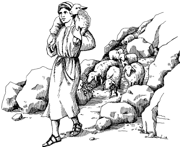
Oveja michiq runa (1 Pedro 5.2)

5 1 *Iglesiaipi yachachiq liderkunatan kunan ruegoakuykichis. Noqapas qankuna hina yachachiq lidermi kani; hinallataq Señor Jesucristopa ñak'arisqanmantapas testigon kani. Saynallataqmi noqaqa Señorinchis Jesucristo kutimuspa, sumaq k'anchariyninta rikuchiwaqtin, anchata kusikusaq paywan kushka. Chayraykun consejamuykichis khaynata: 2 Qankunamanmi Diosqa encargasurankichis, paypi creeq runakunata allinta cuidanaykichispaq. Saynaqa allintayá cuidaychis, imaynan huk allin michiipas allinta cuidan ovejakunata hina. Amayá qankunaqa cuidaychis huk obligasqa hinachu, nitaq qolqeraykullachu; aswanqa ancha kusikuywanyá Diospa munasqanman hina cuidaychis. 3 Hinaspapas qankunaqa