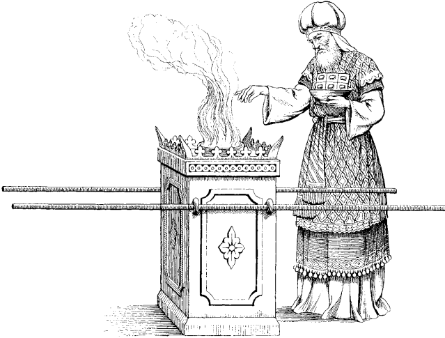
Altarpa ladonpi huk sacerdote (Hebreos 7.13)

imaynan Abrahampa tiemponpipas Melquisedec sutiyoq sacerdote rikhurimuran chay hina. Chay mosoq sacerdoteqa manan *Aaronpa mirayninmantachu kanan karan. Aswanmi payqa sacerdote Melquisedec hina kanan karan. 12 Chayraykun niykichis, huk mosoq clase sacerdote hamuqtinmi, Dios Taytanchisqa huk mosoq clase leytapas qowaranchis. 13 Kay mosoq clase sacerdotemanta rimaspaqa, Señorninchis Jesucristomantan rimashanchis. Payqa manan Leví sutiyoq sacerdotekunapa mirayninmanchu perteneceran. Aswanmi Jesucristoqa Judá sutiyoq runapa mirayninmanta karan. Ichaqa chay Judá runapa mirayninmantaqa manan ni huk sacerdotepas karanchu, *templopa altarninpi Diosta servinanpaqqa. 14 Allintan yachanchis, Señorninchis Jesucristoqa Judá sutiyoq runapa mirayninmanta kasqanta. Ichaqa manan ni imatapas Moisesqa niranchu, Judá sutiyoq runapa mirayninmanta huk sacerdote kananmantaqa. 15 Kaykunamantaqa ancha clarotan rimashanchis. Chaymi kay mosoq clase sacerdotemanta rimasqanchisqa sacerdote Melquisedecman rikch'akun, pay hina kasqanrayku. 16 Hinaspapas Señorninchis Jesucristoqa akllasqa karan manan huk runapa mirayninman pertenecesqanraykuchu. Aswanqa wiña-wiñaypaq kawsayniyoq kasqanraykun