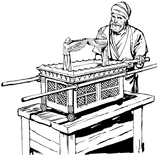
Antiguo Testamentopi imaynas arca kasqan (Hebreos 9.3-5)

9 1 Diosqa ñawpaq tiempopin, Israel *nacionniyoq runakunawan huk *pactota ruwaran. Hinaspan chay pactota ruwaspa, Diosqa kamachiran imaynatas runakuna payta adoranankupaq. Chaypaqmi kay pachapi ratk'a tolderamanta ruwasqa *tabernáculo nisqa *templota ruwaranku. Chaymi chay temploqa runakunapa ruwasqallan karan. 2 Chay runakunapa ruwasqan tabernáculo temploqa ishkey cuartoyoqmi karan. Chay primer kaq cuarton sutichasqa karan “*Lugar Santo” nisqa sutiwan. Chay lugarpin mechero hina k'anchaq huk *candelabro qanchis puntayoyq karan. Hinaspapas kallarantaqmi huk mesa; chay mesapin karan Diosman *ofrenda churasqanku t'antakuna. 3 Chay primer kaq cuartoman qatiqnin cuartoqa huk