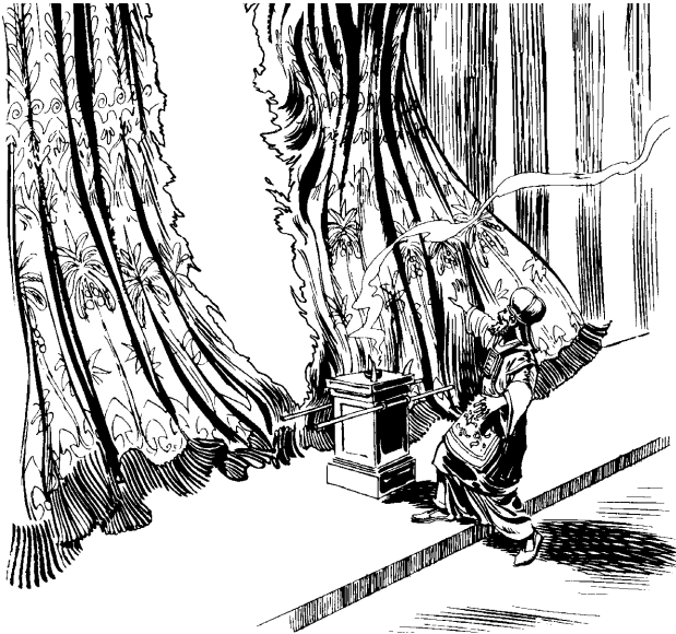
Jerusalén templopi ratk'a cortinapa llik'ikusqan (Hebreos 10.19-20)

20 Ichaqa Señorninchis Jesucriston cruzpi wañuspa, chay “*Lugar Santo” cuartomanta “Lugar Santísimo” nisqa