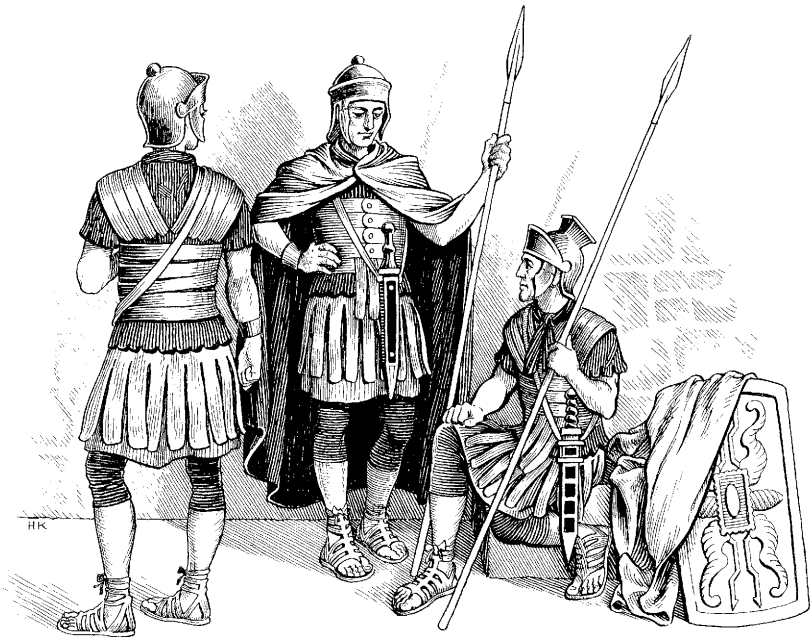
Roma nacionniyoq soldadokuna (Juan 19.2)

19 1 Saynata niqtinkun gobernador Poncio *Pilatoqa Jesusta latigachiran. 2 Chaymantan *Roma llaqtayoy soldadokunaqa, kishkamanta *coronata ruwaspanku, Jesuspa umanman churaranku. Saynallataqmi *reykunapa churakunan nina sansa color capawanpas burlakunankupaq churaranku. 3 Hinaspan ashuyuspa, khaynata niranku: