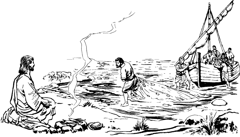
Challwata Jesús kankasqan (Juan 21.1-14)

—Challwa hap'imusqaykichista apamuychis, nispa.