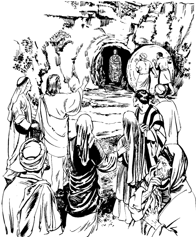
Lazaropa kawsarimusqa (Juan 11.38-44)

41 Hinaqtinmi runakunaqa sepultura tapaq rumita huk lawman ayqechiranku. Hinaqtinmi Jesusqa hanaq pachata qawarispá niran: