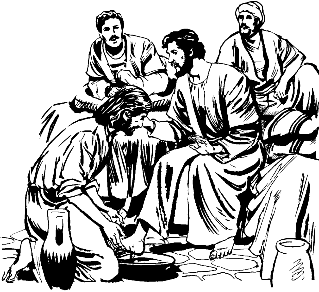
Jesumi discipulonkunapa chakinta maqchin (Juan 13.1-20)

nishaykichis, chaykuna pasawaqtin, noqa Diospa Wawan kasqayta creenaykichispaq. 20 Cheqaqtapunin niykichis: Pipas noqamanta willakunanpaq comisionasqay runata chashkiqqa, noqatapas chashkiwashanman hinan. Pipas noqata chashkiwaqqa, mandamuwaqniy Dios Taytaptapas chashkinmi, nispa.