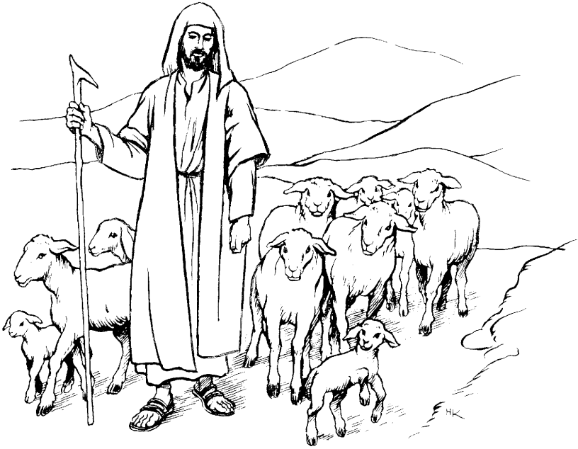
Oveja michiq (Juan 10.1-21)

kashanmi huk ovejaykunapas. Paykunaqa manan kay corralmantachu kanku. Paykunatapas kay corralmanmi apamunaypuni kashan, huk corralapiña kanankupaq. Chaymi paykunapas vozniyta uyarinqaku; hinallataqmi michiqninpas noqa kasaq. 17 Noqaqa ovejaykunaraykun wañusaq, hinaspan kawsarimusaq. Chayraykun Papayqa noqata munakuwan. 18 Manan pipas noqapa vidaytaqa qechuwanmanchu. Aswanmi noqaqa kikillay vidayta qosaq. Hinaspapas noqaqa atiyniyoqmi wañunaypaq, hinallataq kawsarimunaypaqpas kani. Chaytan Dios Taytayqa ordenawaran ruwanaypaq, nispa.