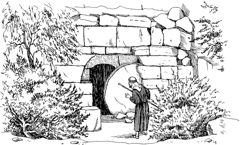
Juan sepultura ukhuta qawayusqan (Juan 20.3-5)

3 Chaymi Pedroqa Jesupa ancha khuyasqan discipulopiwan, sepultura qawaq p'itayllaña riranku. 4 Ichaqa huknin kaq discipuloqa, Pedromanta aswan masta p'itaspanmi, primerta sepulturaman chayaran. 5 Chayaspantaqmi k'umuyuspa sepultura ukhuta qawayuran. Hinaspan Jesupa cuerpon p'istusqanku vendallataña rikuran. Ichaqa manan chay sepultura ukhumanqa haykuranchu. 6 Saynata qawapayashaqtinmi, Simón Pedroqa chayamuspa,