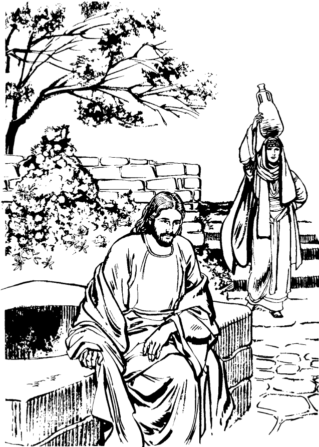
Samaria Ilaqtayoq warmiwan Jesuspa parlasqan (Juan 4.1-42)

—Señor, kay pozomanta unuta orqonaykipaqqqa, manamá ni imaykipas kanchu; hinaspapas kay pozoqa nishu ukhun kashan. Chayri, ¿maymantataq qanri qowankiman chay