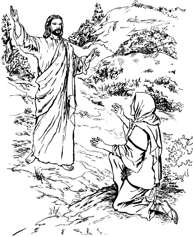
Magdala llaqtayoq Mariaman Jesuspa rikhurişan (Juan 20.11-18)