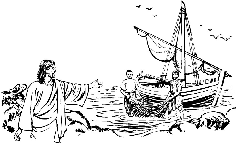
Challwa hap'iq runakunata Jesús waqyasqan (Marcos 1.16-20)

Paykunaqa challwa hap'iqkuna kaspankun *mallankuwan challwata challwasharanku. 17 Hinaspan Jesusqa paykunata khaynata niran: