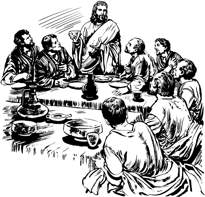
Jesús discipulonkunapiwan santa cena celebrasqanku (Marcos 14.12-25)

17 Chay p'unchaw tutayaruqtinmi, Jesusqa chunka ish kayniyoq discipulonkunapiwan chay cuartoman riranku. 18 Chaypi cenashaqtinkun Jesusqa discipulonkunata niran: