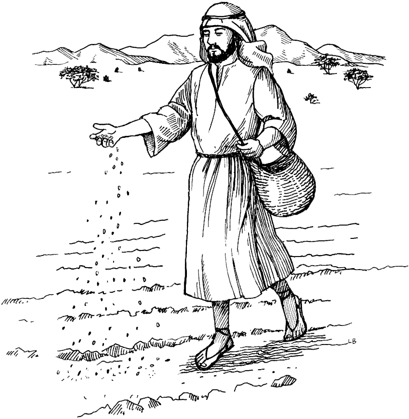
Mukhu t'akaq runa (Marcos 4.1-9)

mukhuñataqmi kishka-kishka ukhukunaman urmaran. Chaymi chay kishkakunaqa, chay mukhu wiñamuqmantapas aswan mastaraq wiñaruspa taparuran; chaymi chay mukhu wiñamuqqa q'elloyaspa mana rururan. 8 Wakin mukhuñataqmi allin wanu allpaman urmaran. Chaymi chay mukhuqa sumaqta wiñamuran. Hinaspan wakin mukhuqa kinsa chunkata rururan, wakintaq soqta chunkata, wakinñataq pachaqta, nispa.