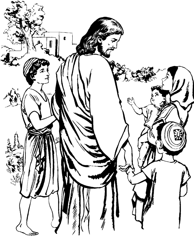
Jesús wawachakunapiwan (Mateo 19.13-15)

15 Jesusqa saynata niruspanmi, sapankama wawakunapa umanman makinta churayuspa, Diosmanta paykunapaq mañapuran. Hinaspan chaymanta ripuran.