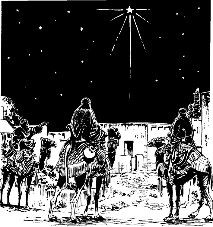
Yachayniyoq reyes magos runakuna (Mateo 2.1-12)

Wawapa kasqanpa altonman chayaruspantaqmi, chay qoyllurqa chaypi sayaykuran. 10 Hinaspan chay qoyllurpa sayasqanta rikuruspanku, chay yachayniyoq reyes magos runakunaqa anchata kusikuranku. 11 Wawapa kasqan wasiman haykuspankun, wawata rikuranku mamitan Mariatawan kushkata. Hinaspan qonqoriyukuspanku wawata adoraranku. Apamusqanku alforjankumanta orqomuspankutaqmi, regalokunata qoranku: qorita, inciensota hinallataq mishk'i q'apaq *mirrawan sutichasqa perfumeta ima. 12 Ichaqa chaymantan Diosqa chay yachayniyoq reyes magos runakunaman sueñoyninkupi willaran khaynata: