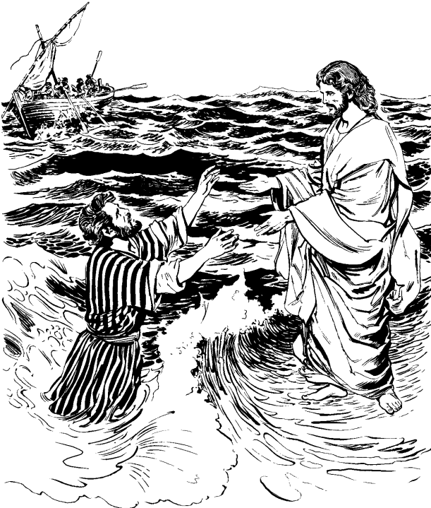
Pedro unu ukhuman chinkayushan (Mateo 14.22-33)