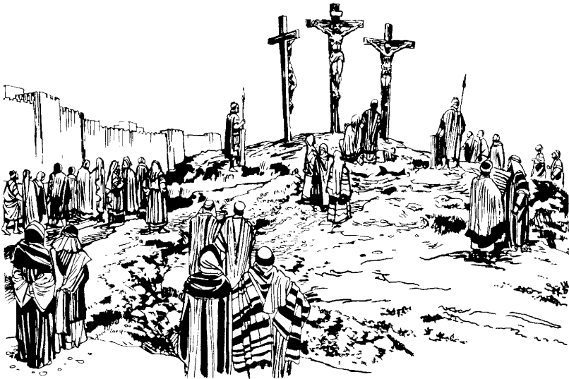
Jesusta cruzpi chakatasqanku (Mateo 27.45-56)

54 Jesús cruzpi wañuruqtinmi, soldadokunapa jefenqa, wakin soldadonkunapiwan Jesusta cuidasharanku. Paykunan chay ratopi terremoto pasaqtin, hinallataq chaypi