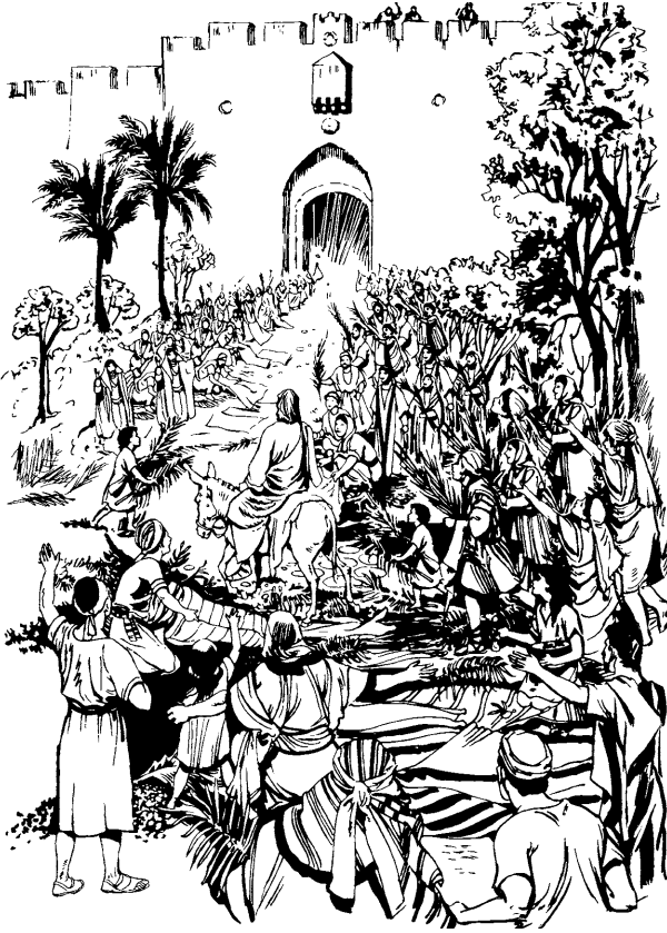
Jerusalén llaqtaman Jesuspa haykusqan (Mateo 21.1-11)

¡Hinaspapas payqa huk humilde runa hinan hamushan!” nispa [Zacarías 9.9].