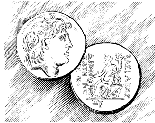
Jesupa tiemponpi qolqe (Mateo 22.15-22; Lucas 20.20-26)

22 Hinaqtinmi Jesuspa nisqanta uyarispanku, chay runakunaqa anchata admirakuspa pasapuranku.