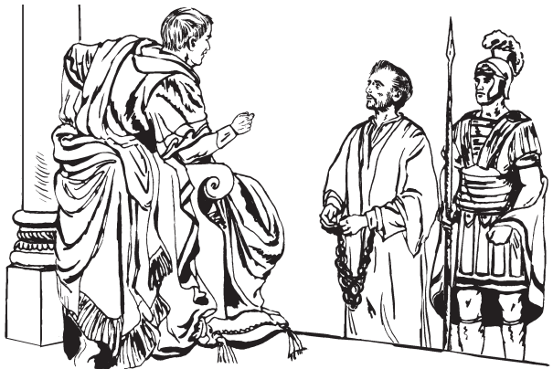
Paul wechi Kin Agrippa yemlotopo Acts 26:1-32

26 1 Agrippa uya Paul pàk, “Eyiwalà euselupa pa elepasak man,” teppù. Paul uya temyatù yenkappù molopai iichelupappù tùwenai sà kasa. 2 “Kin Agrippa! Wakù pe kulu uponalok pe man sàlàpe uselupa tok uyiwalà uwenai eyemlotopo tamù'nawolon Jew yamùk uselupatok uwinàkàik pàk. 3 Sàlà màlà iwalai kulu masapùla ittunài àmàlà wakù pe tamù'nawolon Jew yamùk yeselu molopai ekamappopà'nàtok. Eyekamappo uya sàlà uselupa yetapa tùusemittàpaik pùla.