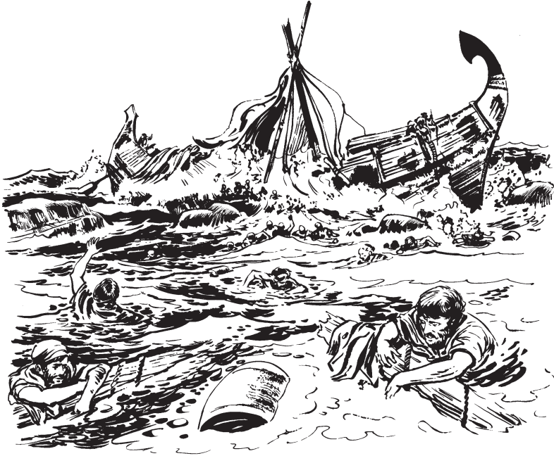
Chipa'chipa uya kanau yaule yalakka. (27:41)

tiyiwalà kanau welepantoppe a'mun pona tok uya ikupùppù. 40 Màlàpàk kanau yessek yewa yattàppù tok uya iwepuka toppe tuna kak, molopai màlà yattai làma yatok ike ipàk yewa yeukappù tok uya. Màlàyau tok uya eke tappulin walai tülùppù kakàik kanau ippai winà, assetun uya kanau yase'ma toppe miya tuna yena pona. 41 Tùse kanau utàppù wàssàk yak molopai iwewomùppù. Kanau ippai pùkkù ya'chichak wàssàk uya wechippù màlà. Màlàpàk iitama yentai iwechippù, chipa'chipa uya kanau yaule yalakka tùse.