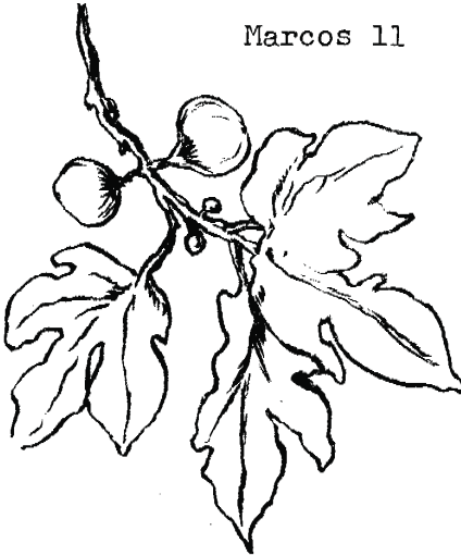
Higuera acue ja.

qui jamanu baqui. 14 Acue ñide jicaguá Jesús. Mi yequinade qui acomayi jana iqui asabi ñi baqui quiaquina.