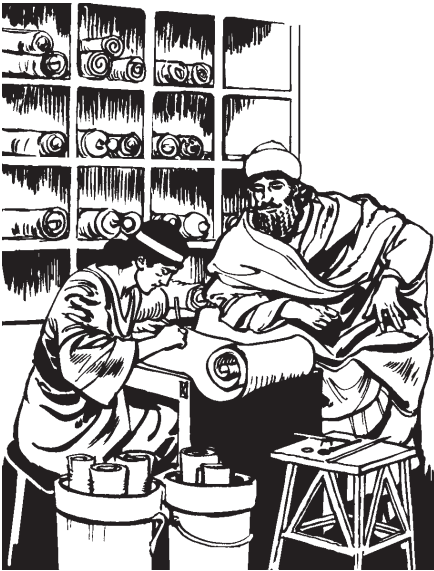
Quijcuilo se amacamanali ica itequihuejcayo nopa tlanahuatijquetl.

nopa amatlajtoli nopa tlanahuatijquetl quinnahuatiyaya israelitame ipan campa hueli altepetini ipan nochi municipios ipan nochi tlaltini ma mosentilica para momanahuise. Quincahuili ma quinmictica huan ma quintzontlamiltica nochi tlen quinequiyayaj quintehuisse yonque tlacame, sihuame o coneme. Nojquiya quinnahuati ma quicuica nochi tlen eliyaya iniaxca tlen quintehuisnequiyayaj. 12 Nochi ya ni monequi quichihuase ipan san se tonal ipan nochi ialtepehua Tlanahuatijquetl Asuero. Huan nopa tonal tlen quiixtlalijtoya elqui ipan 13 itequi nopa metztli majtlaclti huan ome, nopa metztli Adar ipan toisraelita calendario g ipan ne seyoc xihuitl. 13 Huan se iixcopinca nopa amatlajcuiloli monejqui ma tenextilica ipan campa hueli municipio huan ma tematiltica ipan nochi pilaltepetzitzi para queja nopa onca tlanahuatili. Huan quinnahuati israelitame ma mocualtlalise para nopa tonal para quincuepilise inincualancaitacahua tlen