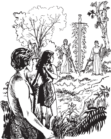
TOTECO Dios quinquixti Adán huan Eva ipan nopa xochimili.

23 Huajca TOTECO quinquixti tlen nopa xochimili tlen itoca Edén. Huan quintitlanqui ma tequiti ipan nopa tlali tlen ica quisencajtoya itlacayo. 24 Huan teipa quema TOTECO Dios quitojtocatoya, quintlali sequin ielhuicac ejcagua tlen inintoca querubines para itztose imelac nopa xochimili ica campa quisa tonati para ma quimocuitlahuica nopa xochimili. Huan