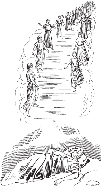
Jacob quipixqui se temictli huan quitayaya se escalera hasta elhuicac.

16 Huan quema Jacob isac, moilhui: “Nelia TOTECO itztoc ipan ni lugar huan ax nijmatiyaya.”