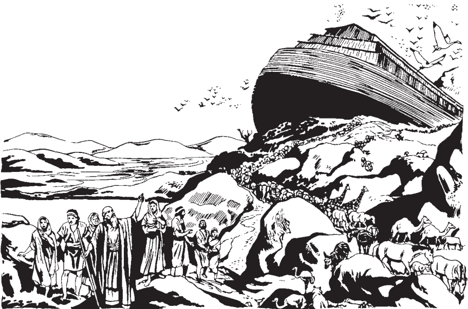
Quisque nochi ipan nopa cuacanhua.