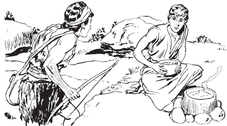
Esaú mocuepqui nelsiyajtoc huan apismiquiyaya.

(Yeca Esaú nojquiya quitocajtiyayaj Edom tlen quinequi quijtos Chichiltic.)