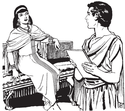
Isihua Potifar pejqui quiixtoca nopa telpocatl José.