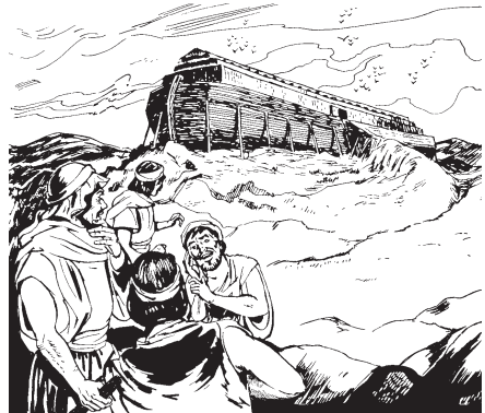
Noé quichijqui se hueyi cuacanahua.

7 Teipa TOTECO quiilhui Noé: “San ta tlen nochi tlacame tlen ama itztoque tijchihua tlen xitlahuac. Yeca xicalaqui ipan cuacanahua ininhuaya mosihua huan moconehua. 2 Xiquinhuica mohuaya chi-