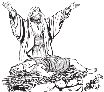
Abraham quiilpi icone huan quitlali ipan tlaixpamitl.

—Ax tlenco xijchihuili nopa oquichpil. Ya niquita para tiquimacasi huan tijnelto-