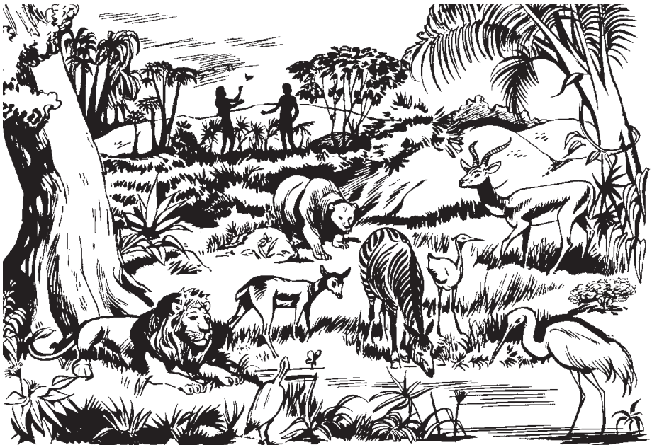
TOTECO Dios quinchijqui ma elica tlacatl huan sihuatl.

24 Huan yeca se tlacatl quicahuas itata huan inana para mosejcotilis ihuaya isihua huan nopa ome mochihuase san se