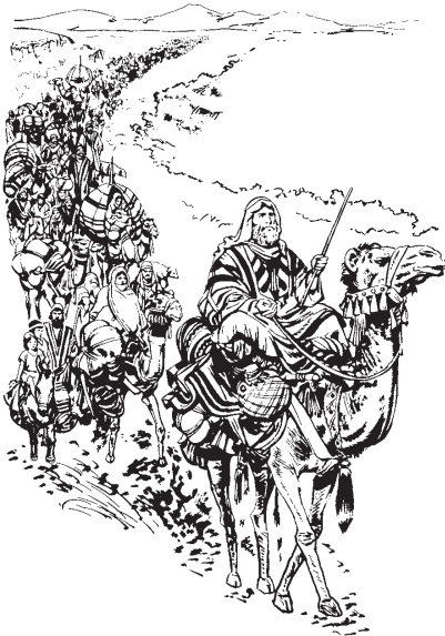
Abram quisqui altepetl Harán para yas tlali Canaán.

4 Huajca Abram quisqui queja TOTECO quinahuatijtoya huan quipiyayaya 75 xihuitl quema quisqui altepetl Harán para yas tlali Canaán. 5 Huan quihuicac isihua Sarai huan imachcone Lot. Nojquiya Abram quihuicac nochi nopa miyac tlamantli huan tlapiyalime tlen quinpiyayaya huan nochi itlatequipanojcahua tlen hualajtoyaj ihuaya tlen altepetl Harán pampa quincojtoya para iaxcahua.