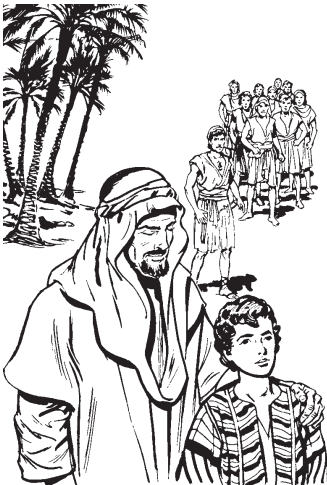
Israel quimacac José se iyoyo tlen huehueyac huan nelyejyetzzi.

—Xijtlacaquilica huan nimechpohuilis nopa temictli tlen nijpixqui. 7 Nijtemijqui para nochi tojuanti tiitztoyaj mila, tijsentiliyayaj tlamontomtl tlen trigo tzontli.