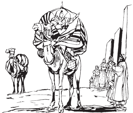
Rebeca ihuaya itequipanojca hua quitoquilijque itequipanojca Abraham.

59Huajca quicahuilijque Rebeca ma yohui ihuaya itlatequipanojca Abraham