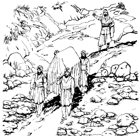
Totajtztizi quihuicayayaj nopa caxa para quiixcotonase hueyat Jordán.

14 Huajca nopa israelitame quisque para quiixcotonase nopa hueyat Jordán, huan nopa totajtztizi tayacantiyahuiyayaj ica nopa caxa cati quipixqui cati inihuaya mocajqui TOTECO. 15 Huan elqui ipan nopa tonali para pixquisti quema nopa hueyat Jordán tatemíc miyac. Huan quema