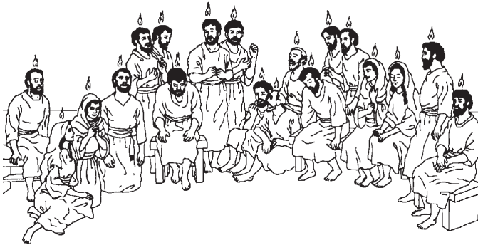
Nuu kîchaa Tati Í Ndioo (2:1)

2 1 Ora kēta iin viko ña jàka'nu ñivi judíu ña nàni Pentecosté, ma kivi ikan kūti'vi tandi'i ñivi chìnuni tu'un Jesuu ma ikan. 2 Ta ikan numini chīni na ña ni'i jà'a yi iti' andivi, takua jà'a iin tati ña ya'a ni'i chàkin ninii ma tichi ve'e nuu ka'lin na. 3 Ta kēta iin ña kàa takua kàa yaa ñu'ú, ta chitakuati yi xini ii'iin na. 4 Ta ndisaa na ki'vi ma Tati Í Ndioo tichi anima na. Ta ikan jan kîcha'a kà'an na siin siin tu'un ña tüvi chito na kà'an na, ti ma Tati Í Ndioo jā'a ña na kutu'va na kà'an na ma tu'un ikan.