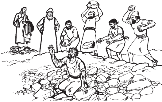
Nuu chā'ni ndra Esteban chi'in yuu (7:54)

ndè'e Esteban ma iti' andivi, tajan te'en nāka'an ra nuu ndra ka'lin chi'in ra: