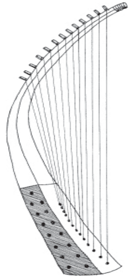
Etèn do nahëeh heen n'aa (Apocrip 14.2)

8 Tii bã ääs seeh, pooj jé hahõm do jawén tabana. Hahỹỹ da ta kyyh: “Gawatsig kãn, gawatsig kãn panang tak'ëp ky n'aa etsëeh do Babirõn häd näng doo! Yỹnh hajõk do sii heỹyh do hadoo Babirõn panang. Tan'oo däk naeng oow mahỹynh do sahõnh hẽ badäk hahỹỹ bã habong do sa hã, tak'ëp baad nadoo do ramoo bok hyb n'aa ta sii, P'op Hagä Do kawajãän tan'oo bã sa wë.” z 9 Tii bã ääs see ana kãn, ääs pooj jé hah'ũüm do sa jawén. Tak'ëp ta kyyh. Hahỹỹ da taky hadoo: “Jé tabanas'aa akajar me hanyyh do hyb n'aa jew'yyk doo, kabarii ti tabanas'aa heen n'aa hyb n'aa jew'yyk do na-ãäj hẽ, jé gadoo do tabanas'aa heen n'aa ta maboora hã, ta moo hã radadäk hyb n'aa, 10 ta ti hedoo do P'op Hagä Do rejãä da sa hã tak'ëp takawajãän doo gó. Tak'ëp sa hã tarejãä do rahoop da. Dooh da P'op Hagä Do t'yyd mehĩin bã sa hã.” a Ta ti hedoo do rahoop da pä hadoo saw'aak do hahõng do tak'ëp mahỹynh doo. Ääs P'op Hagä Do wë kasëew bong do sa matym gó, B'éé T'aah matym gó na-ãäj hẽ rahoop da tii. 11 Rahoop do tsyg as'ëeg had'yyt hẽ da. Dooh tahëej bã tii. Dooh da takan'oo bã rakameh'ãäk pé rahoop do hyb n'aa. Tabanas'aa, kabarii tabanas'aa heen n'aa na-ãäj hẽ hyb n'aa jew'yyk doo, ta häd heen n'aa gad'oo do rahob had'yyt né da”, näng ääs kyyh.