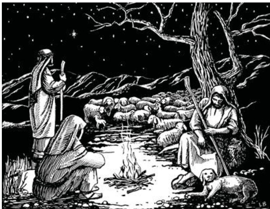
B'éé hag'ãas do sa heen n'aa (Rukas 2.8)

panang paa bä, bë h'yyb tym dëéb. Kristo, c P'op Hagä Do H'yyb Däng Doo, Tak'ëp Hyb N'aa Jawyk Do tii —näng mä ãas kyyh.