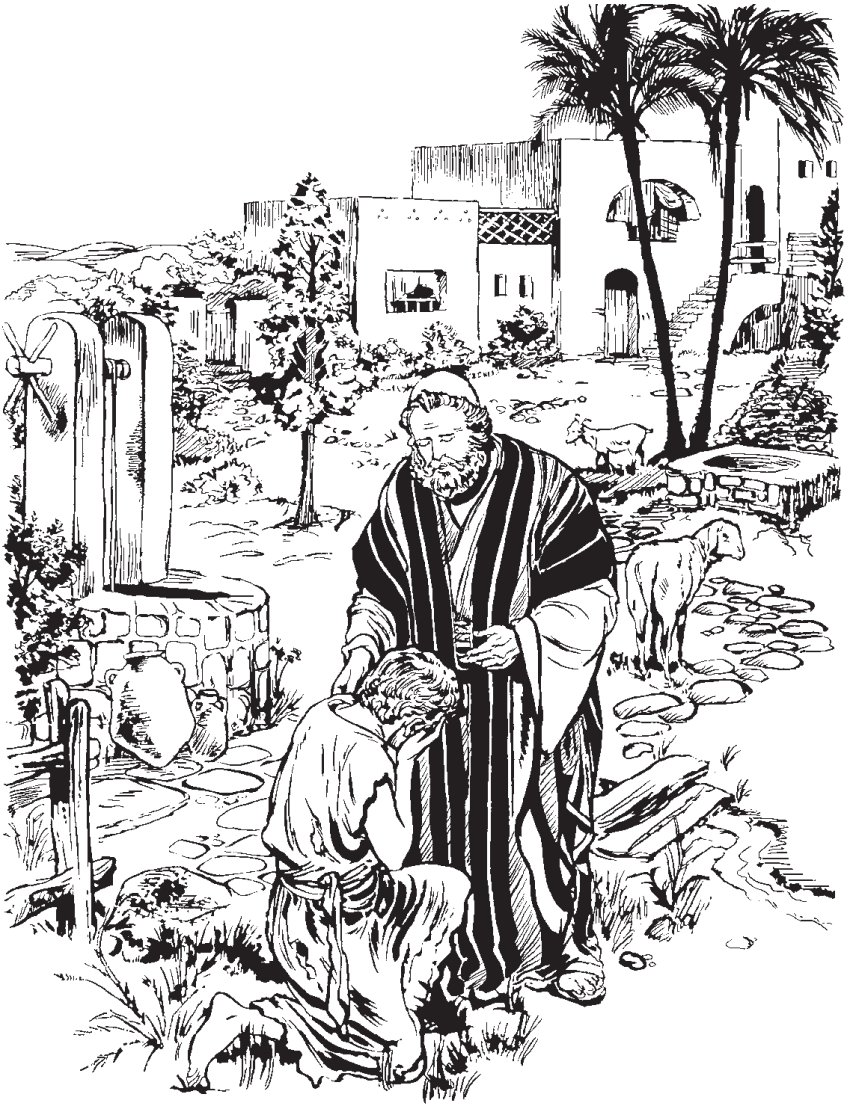
Aj'yy ta yb wē matēēh do heen n'aa (Rukas 15.20-32)

tabad'op hē man'oos pé b'éeé t'aah, najis ŷ daheeh āā tsebé do tā n'aa", näng ta kyyh. 30 "Hŷŷ kā a t'aah mahanäng doo, ŷŷj hajök sii he'ŷŷh do hā tabahäj jëng do a dajëēr tababaaj nā bā kā, mamejūū ranabooh booj yb hepuh doo!", näng wah'ëēh hadoo do ta yb hā.