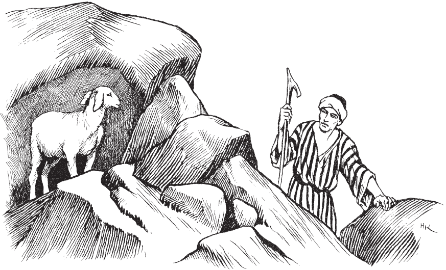
B'éé kanapëë wät do heen n'aa (Rukas 15.1-7)

ratsebé nesaa do moo hew'ëët do paa see P'op Hagä Do hä tah'y'y kawareem bä.