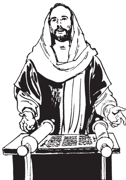
P'op Hagä Do kyy kerih do Jesus ner'oot do heen n'aa (Rukas 4.16-19)

15 Tób P'op Hagä Do panyyg rayd naherot do yt hã tama metëek mäh. Sahõnh hẽ m' raj'aa etsẽ ta hã.