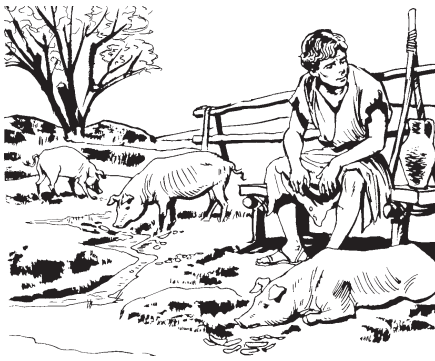
Aj'yy too yb hag'aäs do heen n'aa (Rukas 15.11-19)

ÿ babaaj hõm ee wë”, näng ta kyyh. “ÿ maher'oot ta ti ee”, näng. “‘Ee’, näng da kēh ÿÿ”, näng, “‘nesaa do ÿ moo wäd wät P'op Hagä Do hä, a hä na-ãaj hē’, näng da kēh ÿÿ”, näng ta kyyh ta h'yyb gó. 19 Ti tahyb n'aa newëë ta h'yyb gó: “ÿ etsëë da ÿ moo wät doo. ‘A karom däg da ÿÿh. Dooh a t'aah ÿ doo wäd bä’, näng da ÿÿh”, näng ta h'yyb gó. 20 Ti tababaaj nä kãn p'aa hēnh kã ta