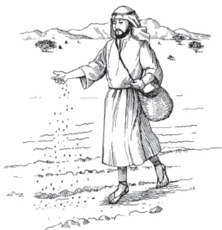
Joom hejóm do bejoom do joom tym heen n'aa (Matew 13.1-9)

15 “Ta ti ÿ wén her'oot Judah buuj sa ky n'aa hã”, näng mã P'op Hagä Do Isajas hã,