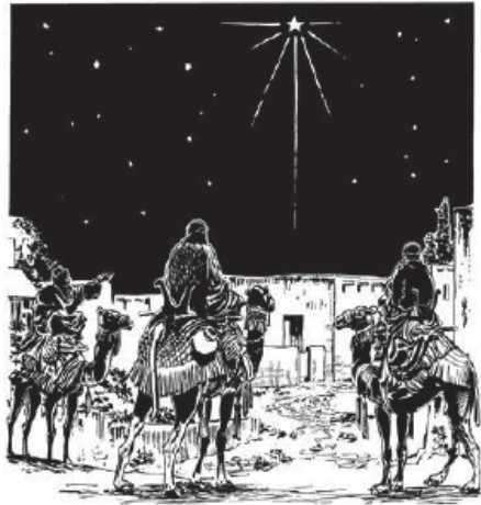
Ajyy sagõoh ma kamahet'ëëk do sa heen n'aa (Matew 2.1-2)

—Nyy bä tabadäg däk Judah buuj sa wahë n'aa nag'aap hë henäng doo? —näk mäh. —Ãã hapäh sagõoh tabenyy däk do heen n'aa. Papÿÿj nu ganyy hënh tahana. Ãã wén na bë wahë n'aa