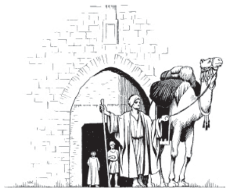
Kameer heen n'aa (Matew 19.24)

—Sahõnh hë papuuj tabahadoo bä kä, sa wahë n'aa heh'äät do tyng n'aa jó, tak'ëp hetsooh do jó, Aj'y y Hadoo Do Hÿ Pong Jé Hana Do basooh bä kä, tadu doo bä kä tabag'ääs doo, bëeh, 12 hedoo doo, hëp ÿ hata hadoo doo, bë na-ääj da bë at'oonh da 12 bagä n'aa tyng n'aa jó, 12 Isaraéw taah panaa bë bag'ääs hyb n'aa, bë ky n'aa etyy hyb n'aa. Né hup ÿ né hë ta ti ÿ her'oot doo. 29 Hëp ÿ n'aa heréd hõm pé ta tób, heréd hõm do ta wakään, ta änh, ta yb, ta ÿyn, ta taah, ta joom banäng doo, 100 nuu me bahãnh do hajõng do tagadoo da baad hadoo do ta mabaj. Ta jawén kä, hÿ pong jé kä tagadoo da edëb had'yyt doo. P'op Hagä Do pa tabawäd had'yyt da. 30 Hajõk babä hyb n'aa jewyk do wób, ta jawén kä hyb n'aa sekog padäg its da hÿ pong jé. Hajõk babä hyb n'aa sekog is do wób kä ti noo gó kä hyb n'aa jewyk kã da —näng mä Jesus kyyh.