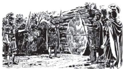
Jesus kamag n'aa hood warahén rahag'ääs do heen n'aa (Matew 27.64-66)

66 Ti m' ta kamag hood noo bā rabats'aa däk ky n'aa jaw'y'yk do heen n'aa, ta ma matëg ranoo gasëets hōm mahānh. Ti m' ramejūū warahén rabahag'ääs hyb n'aa.