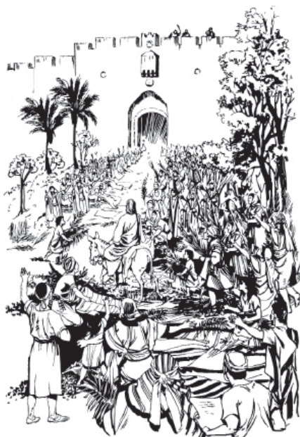
Baad Jesus ragadoo do Jerusarënh bã do heen n'aa (Matew 21.1-11)