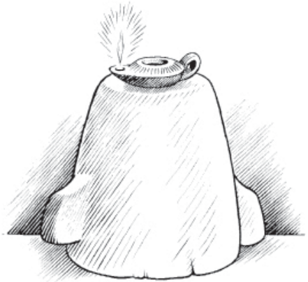
Ta bag ta tyng jó ji dasooh do heen n'aa (Matew 5.15)

do P'op Hagä Do anoo da bë hä ta sãm hÿ pong jé. Ti hyb n'aa da bë h'yy gadejah, bë tsebee da, tii d' bë hä radoo bä né paawä! Tii d' né paa sa wahë makû rabad'oo P'op Hagä Do ky n'aa rod sa hä, rarahejãã né paa sa hä —näng mä Jesus.