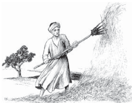
Aj'yy ta nahëë me tetyn hõm do tiriig ta bóg mahãnh do heen n'aa (Matew 3.12)

7 Ti m' hajõk Pariséw ramaneënh doo, hajõk Saduséw ramaneënh do na-ããj hë ta wë, tanu gemuun doo bã rabana Jowãw bahapãh bã, taky hadoo mã sa hã: