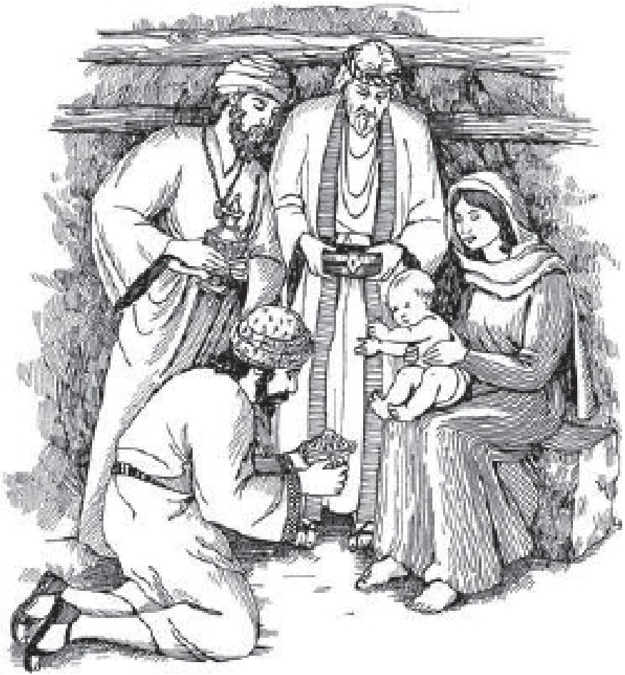
Jesus sagõõh ky n'aa ma kamahet'ëek do raweh'ëeh (Matew 2.11)

11 Ti m' tób gó rabajëë p'ëë bã kä rabawyyd kån mä karapee Marija moo gó kä. Ti m' rabehyy b'ëeh tũũ sa taron nu paa me karapee t'aah wë. Ti m' rawehëë kån ta hã. Ti m' raban'oo däk ta hã ta matym n'aa tak'ëp hanãm doo, ky n'aa gebah doo. K'ãäts tæg gabarëeh do s'ëeb, b'aa tæg buu benyym do s'ëeb in-sijëen häd näng doo, b'aa tæg buu benyym do s'ëeb miir häd näng do raban'oo kån ta matym n'aa. 12 Ti m' sa s'ëë gó kä P'op Hagä Do maher'oot ranabaaj hõm hyb n'aa Eróts magä doo me, Eróts ramanaher'oot hyb n'aa. Ti m' ta tyw n'aa see me m' rababaaj hõm kån sa hãj n'aa hënh.