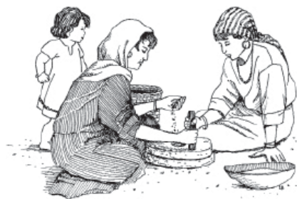
Tiriig ag ȳȳj rakaōōj jëng do heen n'aa (Matew 24.41)

pawóp hē hedoo pé ajyy gëew gó moo bok doo, sa see da ȳ mahũũm si ȳȳ, ta see da keréd hõm. 41 Pawóp hē hedoo pé ȳȳj tiriig ramoo bok doo, sa see da ȳ mahũũm si ȳȳ, ta see da ȳ eréd gëët. 5