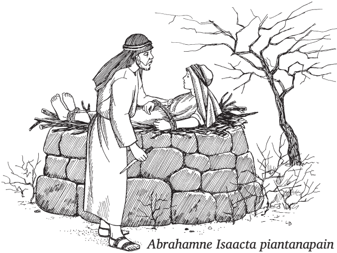
Abrahamne Isaacta piantanapain

20 Isaacne Dios kaizta aizpa watcha i nijkulta. Isaacne Diosta paikwara, Jacobkas Esaúkas Dios kin namtit aizpa mamaz payura sappanapa, Dios usparuza wat kiwainanapa.