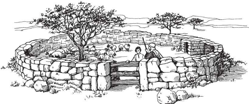
Pirikuruz uspa pitmukin pura, piriku izmumikakasa

14-15 Nane wat piriku izmumikakana ish. Pirikuruzne nawa nijkulamturuz mai. Ap Taittane nawa pian. Kawarain Taittara