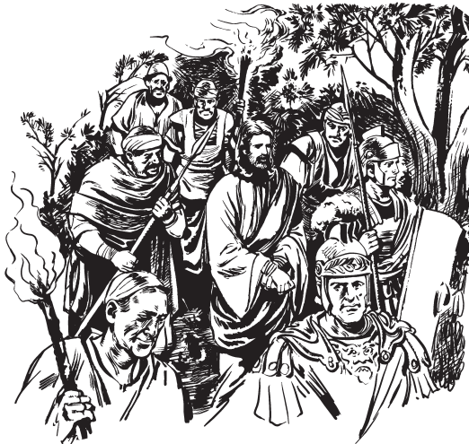
Jesústa milamtu Olivos izakis

18 Tih pamtu akwa, kiwainmuruzkas pariyawa kiwainmuruzkas kunat kit imchaj in usappat kit ikulara. Pedrokas uspakasa ikul kit kunazi.