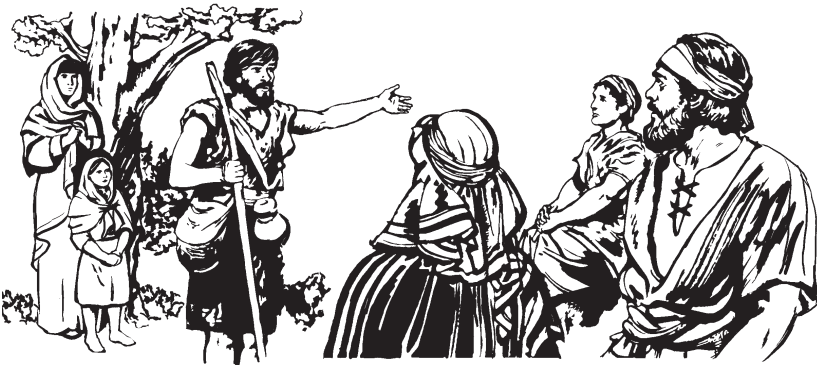
Juarne, kwazikasa munnammikane, Dios pit kainanamtu

14 An Pit muntitmikane awa namta. Usne awaruza pashinat kit kiwainnashimtu. Uskas aumiza nil kamtanara, Diosta piankamanapa. Usne aukasa an sukin uzta. Aune ussa iztamakpas. Usne kwisha wat kai puzta. Diosne paiña painkultain kwisha tinta namninta. 15 Juarne us akwa paranat kit kaizta: “Nane us akwa usparuza kainanarau. Us nawa kwizpa amtukas, usne nakin an ñancha uzta. Usne nakin anza tinta i.”