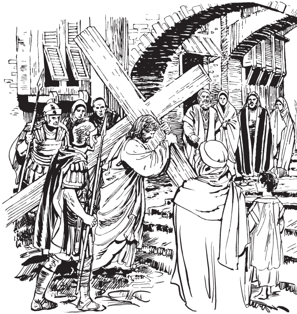
Jesús kurish murit imtu