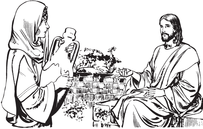
Jesús Samaria pipuluras ashampara paramtu

—Nune Judío awa i. Nane Samariakis ashampa ish. ¿Chikishma nawa kwazi paikumtus?