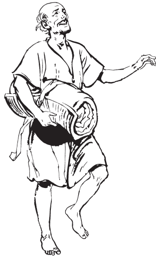
Chasachimika chamtu paiña kamakasa

15 An ampune it kit Judío awa ininturuza Jesús ussa kakulninta kainanara. 16 Katmizna Judío awa ininturuzne Jesússta kwail kishara, us kwaizkulmu payura sun kal kirit akwa. 17 Jesúsne usparuza sinkanat kit kaiznara: