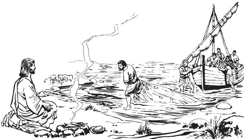
Kammuruz akkwan pishkaru tainñamtu