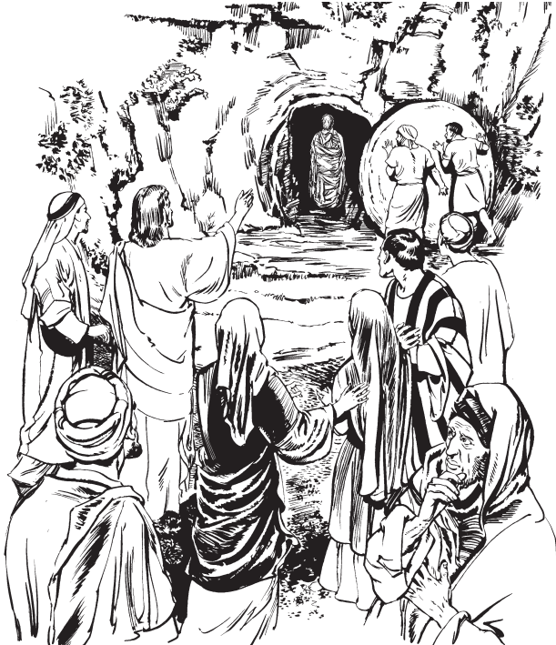
Katsa ukta nupaintu Lázaro kamtitkis