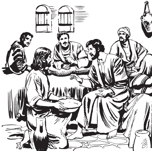
Jesús Pedrowa mitti kittu

11 Jesúsne min ussa chihkamtumika pian. Katmizna ka kizta: “Mazane sinam sarachi, paiña kwail kirit aizpa sinam kwiznintachi akwa.”