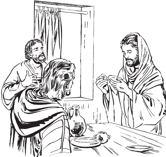
Jesús Emaús pipulukin pan kiztu

Us sun paasta mımara akwa, uspa paasne iztaspat kit kunat kit tayalpailta. 18 Mazane, Cleofas muntitmikane, ussa mımara: