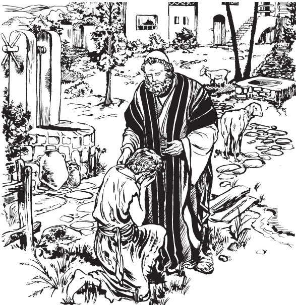
Papihshne painkulta saptu

11 Jesúsne mamaz kamtam kwinta kaiznara: “Maza ampune paas painkulkasa uzta. 12 An ainkimikane papihshta kaizta: ‘Taitta. Nawa paimpa su milazha. Papihshne uspa paasta sukas