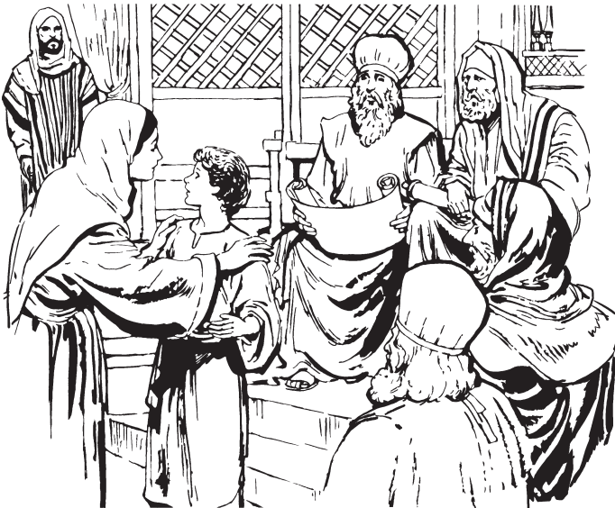
Josékas Mariákas Jesústa Dios katsa yalta saimtu

41 Mane paiña papihshkas paiña akkuhshkas año aizpa Jerusalén pipulura iilta, Pascua pishta izna. 42-43 Jesús doce año pintikane, cham pishta taizkane, kutñaruzne Jerusalén pipulura nuara. Pishta pailtawane, kailpailta. Pashpa Jesúsne Jerusalén pipulurain nukkultit. Paiña kwalne Jesús nukkultit pianchi. 44 Uspane maza payus iara. Uskasa mamaz awakasa aamtuka