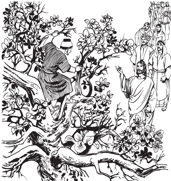
Jesús Zaqueora paramtu

—Jesúsne kwail kimtuzkasa yalta nap kit nukkultu, kizara. 8 Kwiztane Zaqueone awaruzpa paizkakin kun kit Anpatta kaizta: