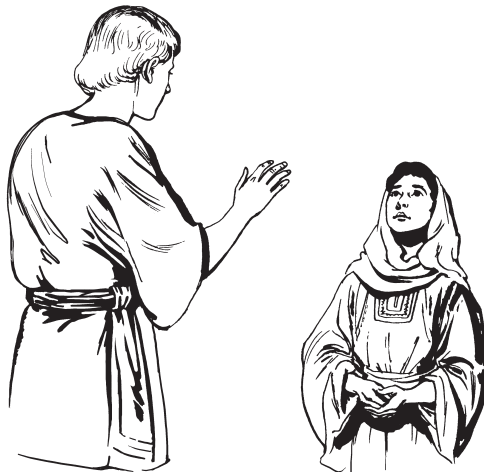
Ángel Maríara paramtu

29 Ángelta iztane, Maríane ishkwat kit ángel kaiztu aizpa minta. “¿Usne chikishma sun nawa kwinta kimtu?” minta. 30 Suasne ángelne ussa kaizta: