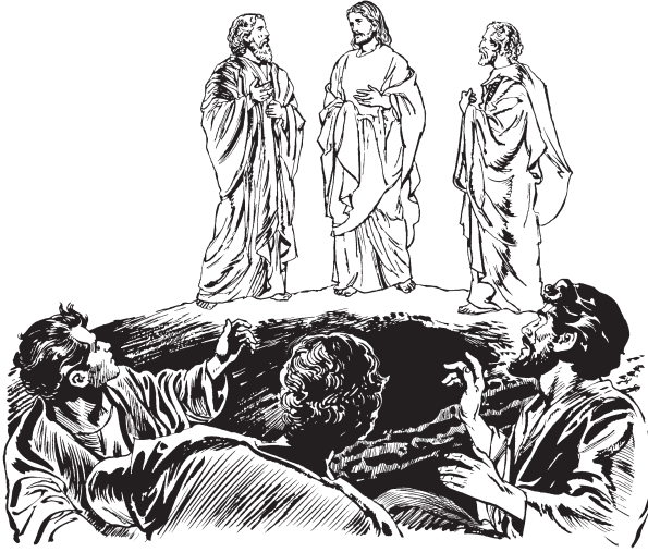
Jesúskas Moiséskas Elíaskas; kammuruz pula pura

ruzne ishkuara. 35 Diosne wanish ayukmalsih ka kiznara: “Anne ap painkul i. Ussa narau. Ussa mirain,” kiznara.