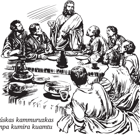
Jesúskas kammuruzkas minpa kumira kuamtu

—¿Aune minpa ianapai, Pascua kumira ainana? kizara.