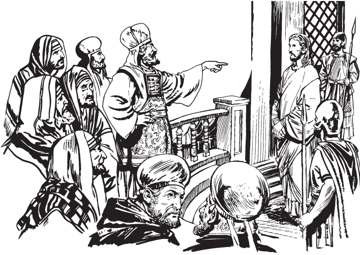
Jesús katsa pariyakin kuntu

—Nane Cristo ish. Une nawa, Ampu namtitmikara, izanazi. Nane au katsa Diospa numal tuanash. Suane nane Dioskasa watuza ininnanash. Na chiyuras kailkane, une nawa wanishta izanazi, w kiznara.