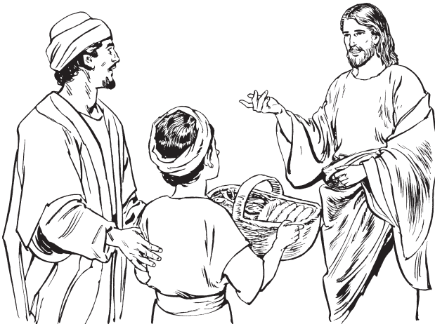
Jesúska Andréska pashpakas pankasa pishkarukasa

—Aune cinco pankas paas pishkarukas mijmakpas, kizara.