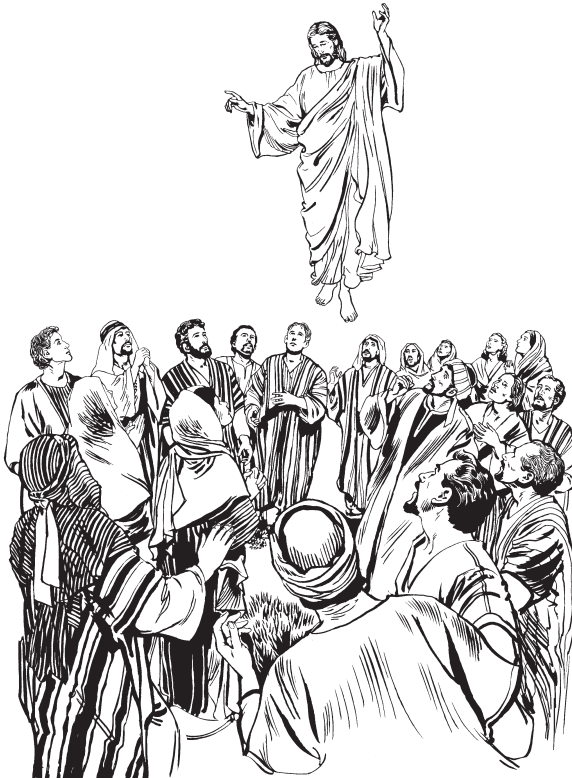
Kammuruz izamtuasmin, Jesús chiyura numtu

14 Mamaz payura once kammuruzne uzat kit kumira kuara. Suane Jesúsne usparuza ira, ussa izanapa. Dios watcha Jesústa mamasa kuhsnintitkas, uspane izara aizpa nijkulashitchi. Uspa Dios Jesústa mamasa kuhsnintit aizpa nijkulashitchi akwa, Jesúsne usparuza tinta pilchashinara. 15 Suasne Jesúsne usparuza kaiznara: “Wan suwara irain. Pailta awaruza Dios watsal pit kainarain. 16 U Dios watsal pit nijkulturuza munnanarane, Diosne usparuza watsal milnanazi. Dios watsal pit nijkultuchiruzne, paiña kwait akwa ĩnta naizarinazi. 17 Dios pit nijkultuzne, Jesústa paikuntuzne, kwait saliz puzninnanazi. Uspane mamaz