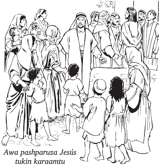
Awa pashparuza Jesús tukin karaamtu