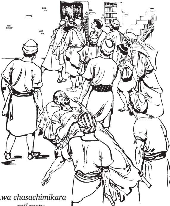
Awa chasachimikara milamtu

Suasne Mateone kuhsak kit ussa kanpara. 10 Sun payu Jesúska paiña kammuruzkas Mateowa yalta kwan iara. Akkwan Roma gobiernowa pial sapmuruzkas mamaz kwail kimtuzkas piannaara,