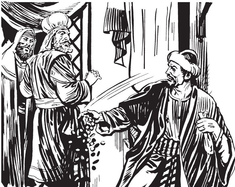
Judas 30 pial kiakpintu

—Nane kwail kirau, na kwail kitchimikasha innapa chihkat akwa.