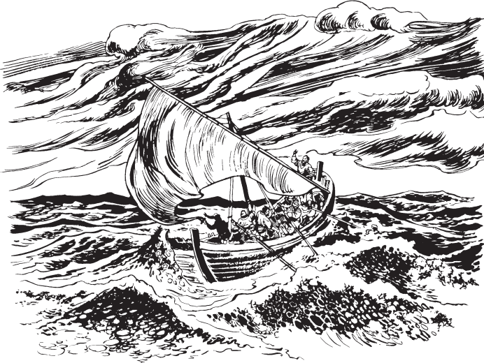
Tinta inkwa kanuara nupaintu

—Anpat miri. Ap taitta irikane, nane an ñancha ussa kamna inash. Ussa kamtawane, kwiztane nua kanpanash, kizta.