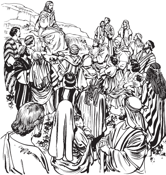
Jesús izakin awaruza kamtanamtu