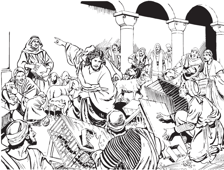
Jesús painintuza Dios katsa yalkis ininnamtu

12 Jesúsne katsa Diospa yalkin nap kit wan paininturuzakas paimturuzakas pianamal tinta ininnara. Pial maizmuruzpa mi-sharirakas utkuru paininmuruzpa uzmukas kiakpinnat 13 kit kaiznara: