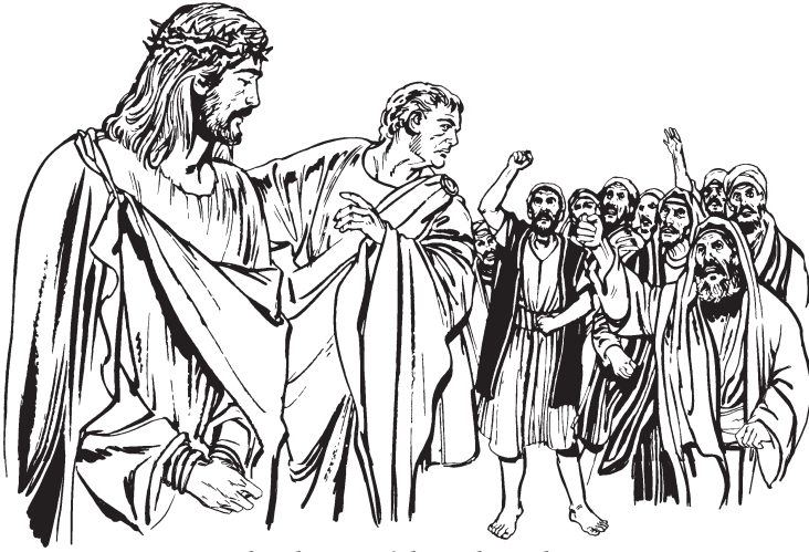
Pilatokas Jesúskas aliztuzkas

27 Suasne ininmikawa suldaruruzne Jesússta Roma ininmikawa yalta milara. Wan suldaruruzne Jesússta mamin pilsaarit. 28 Suasne uspane paiña pñ nakaat kit kwanamkana pñ, mi-kwawa kwakshamkana, kwaninñara. 29 Uspane akkwan pu tit iptit kit mikwawa chuttakana saara. Suasne paiña kizpukin sinaara. Maza mikwawa tikana paiña numal chihtikin piznina. Suasne uspane us iztakin wakpuj wainñat kit ussa ishanat kit kaizara: