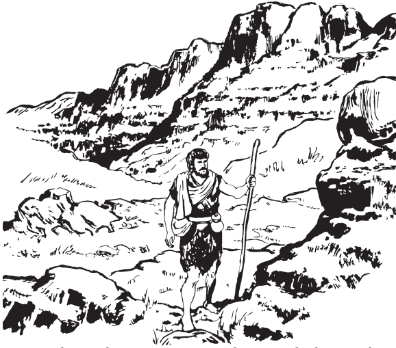
Juanne, kwazikasa munnammikane, inkalpara chamtu

4 Juanpa pīn kwara aizpa camello ashkasa sipta. Aya tit pija-kin kuhtit. Ittalkanakas mishkikas kwat. 5 Jerusalén pipuluras awakas wan Judea suras awakas wan Jordán pimakin uztuzkas puzat kit ussa mina aara. 6 Uspane uspa kwail akwa tayalat kit uspa kwail kiarit aizpa kaizara, Dios usparuza wat kulninnana-pa. Suasne Juanne usparuza Jordán pira munnanara.