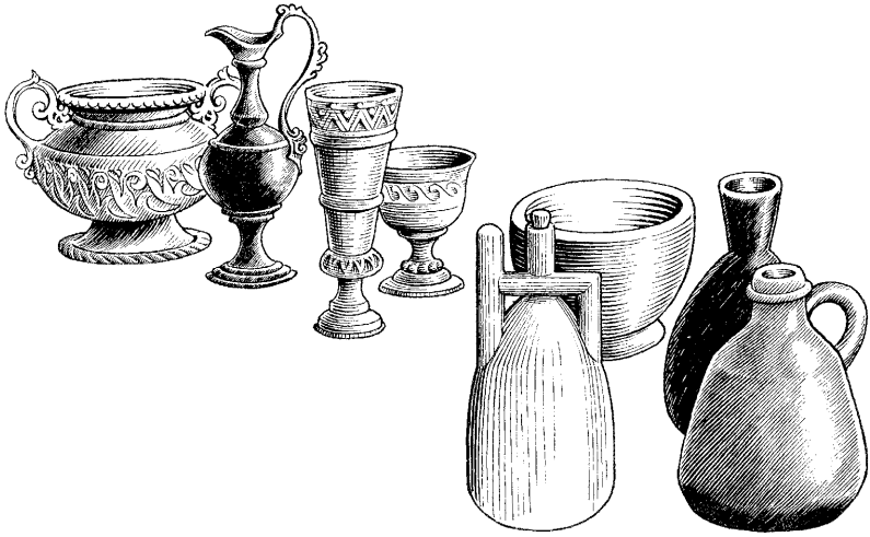
(2 Timóteo 2.20)

oko ane daga dioteci nigijoa niigaxinaganegeco ane degewiteda, eotedibige me yakadi me ibake nigini oko mepoka dibatema. Nigini oko ja igotema Niotagodi me ibake, codaa ja dinenyagadi meo okanicodaagica nibakedi anele.