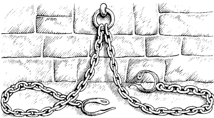
(2 Ti 1.8)

8 Taatnaḡutin kanḡuginagu iḡisimarauḡhiñ Atannaptigun, unniñ kanḡuginaga uvaḡa Ilaan isiqtaḡa, aglaan nagliksaaḡhiñaaḡulutin piqutigilugu tusraayugaallautaq Agaayyutim sayaqaqtitchiḡhagun ilipnik. 9 Ilaan anniqsuḡaatigut suli tuḡḡuḡaatigut iḡmiñun iñugisrukhuta, pisigisruḡaḡnagu savaavut, aglaan pisigiplugu Ilaan sivunniutini suli iḡuaqqutni.