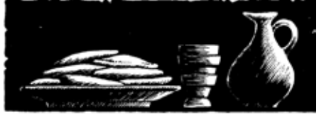
(1 Co 11.26)

qiaq itqakkutigiyumagiksi tuqułıǵa piqutigiplusri.” 25 Taatnatunsuli nultautchianikamiñ tigonıǵaa qallun nipliǵhuni, “Una qallutim imaǵa augıǵıǵa. Auga maqıtuniaqpan ilipsitñun taimma nutaaq sivunniugun aullaǵniñiaqtuq. Imıǵagıǵupsı uumakǵa qallutmiñ itqakkutigiyumagiksi tuqułıǵa piqutigiplusri.” 26 Tarra niǵıraǵıǵupsıuñ taamna qaqııaq sulı imıǵıǵu qallutmiñ taavrumuuna qulıaqtuagıksı tusraayugaagıksıuaq Atangum tuqułıǵagun agıtiqıñıaıǵhanunaglaan.