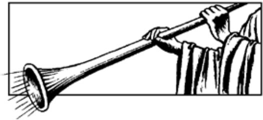
(1 Co 15.52)

51 Naalağniñlagitchi, uqautigipsi nalunaqtuamik itna—iluqata tuqu-niangitchugut, aglaan iluqata simmikkauniaqtugut. 52 Simmikkauniaqtugut akkuvaaurapiaq, sukatluglugu siqungipak-sağniñaniñ irim, aqulligmi qalğuqtaqpan. Qalğuqtaun nipliqsağluqqaqtuq iluqatiñ tuquñaruat anjpkagnaqtut