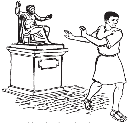
Duökkë jak cï kiëët kɔŋ door acin (10:14)

14 Këya, miëthakäi nhiaar, duökkë jak cï kiëët kɔŋ door acin. 15 Yen ajam tënë we rin aŋiec lɔn ye wek kɔc cï nhïim bak, takkë wët luëel kënë yic wepuöth ë röt. 16 Tē dëk ɣok biny ye ɣok dek muön abiëc miëth Bëny yic ye ɣok Nhialic leec thïn, ke ɣok aa rɔm riem Raan cï lɔc ku dɔc. Ku tē beny ɣok ayup ku camku, ke ɣok aa rɔm guöp Raan cï lɔc ku dɔc. 17 Rin ayuömm tök yen atö thïn, ke ɣo ebën cɔk alɔn juëc ɣok, ɣok aa guäp tök rin ɣok ayuömm tök rɔm.