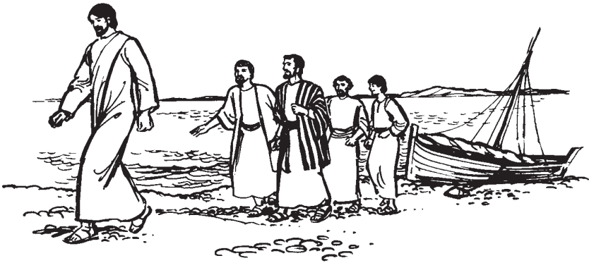
Ku nyiëñjë këriëëc ëbën piny ku buothkë Jethu (5:11)

8 Nawën tiñ Thaimon kë cï rot looi, ke gut yenhiol piny Jethu nhom ku lueel, “Bëny, jäl tënë ya, yen ë raan la guöp adumuööm.” 9 Rin yen Thaimon, ku kəc awën mëi kek ye aake cï gäi rec juëc cik döm. 10 Ku kocken cath kek ye Jemith ku Joon, wëët Dhubedi, aake cï gäi aya. Go Jethu lëk Thaimon, “Duk riöc, ëmën le tueñ aa kəc kek aaba ya döm.” 11 Gokë riäth yöc wär thok ayeer, ku nyiëñjë këriëëc ëbën piny ku buothkë Jethu.