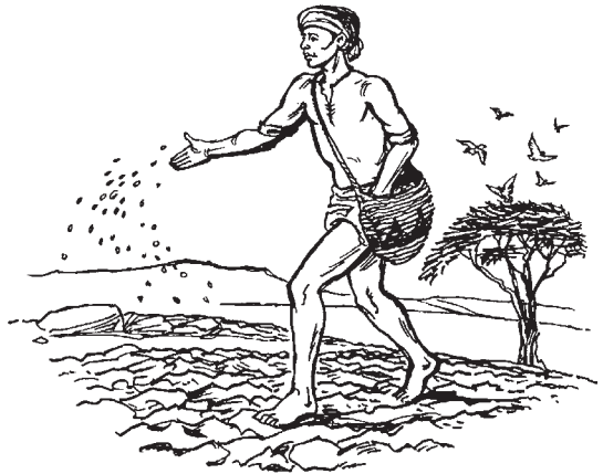
Raan puör ëci la dom bi la pur (8:5)

4 Go kəc juëc aa guëer tënë Jethu geeth yiic, go ke lëk käñ kënë, 5 "Raan puör ëci la dom bi la pur. Ke wën ye yen rap wëer dom yic ke köth abëk lööny dhöl yic të ye kəc tëek thïn, ku tet diet ke aya. 6 Ku lööny köth kök alël nom të koor tiöp thïn. Nawën ciilkë, ke ke go gu riau rin këc meiken yet piny