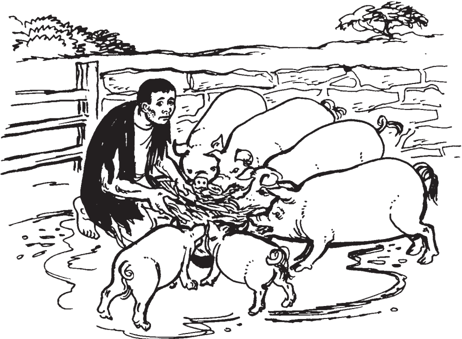
Ku ëye wīc diēt cök yeyäc thiöŋ kē ye dir cam (15:16)

“Tëwën ŋoot yen tēmec ke baai, ke tīŋ wun ke bö. Go puü la yum ku riŋ tēnë ye ku pëet yic ku cim gēm. 21 Go wëndë lueel, ‘Wä yen acī kërɛɛc looi tēnë Nhialic ku tēnë yī. Yen acīi ben piath nadë ke ya cöl ë yī.’