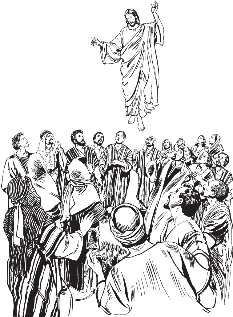
Tewën dɔɔc yen ke, ke jiël tënë ke ku jɔt ë nhial (24:51)