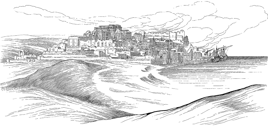
I' dör ká kiè Jope e'. (Jonás 1.3)

aneule iwák kéköl a: “iSa' tsatkó, sa' tsatkó!” Eta dalì kos tuléttsami dayè kì as kè kanò katsirwa.