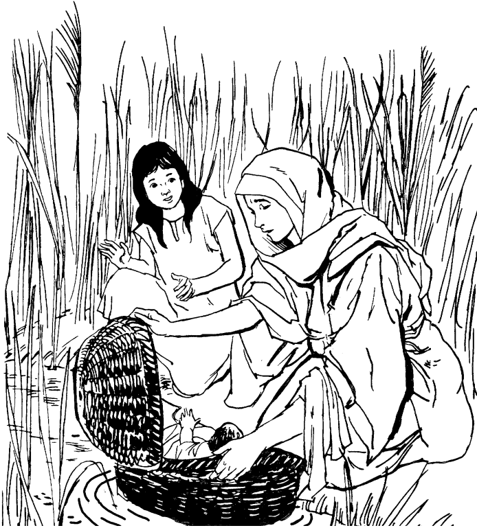
Moisés m̄i tō iiek̄a k̄kó a itsatkoie. (Éxodo 2.3)

—¿Be' ki ikiane tō ye' mi' tayē hebreowak yulōk ekōl be' a alala se k̄kō'noie as itala'ñitō itsu' wa?