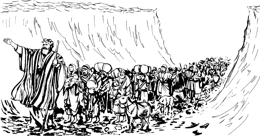
Dayè wötukì atë wì'kè iö'kè as Israel aleripa tkòmi. (Éxodo 14.22)

23 Etä egiptowak ñippökwakpa mirwä kabaio kì ena karreta kì e'pa kos tò Israel aleripa tötümi dayè a. 24 E' bla'mi ká ñirketke etä mò wöñarke bö'wöie e' shüa Jehovah tso' egiptowak sauk. Ie' tò ie'pa suawéka tajè e' tò ie'pa wöa ká chówéka tajè. 25 Ñies ie' tò ie'pa karreta wöshki kos e' wötélur dó a as kè ishkò bet. Ie'pa tò iché ñi a: