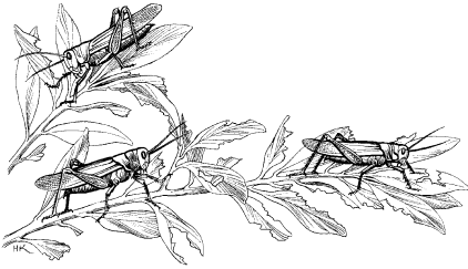
Ditski alõnekā taië Egip- to. (Éxodo 10.1-20)

e' katélur ditski tō yēs. Egipto kōs a kākō kōs kal kō kōs e' kē ateia yēs.