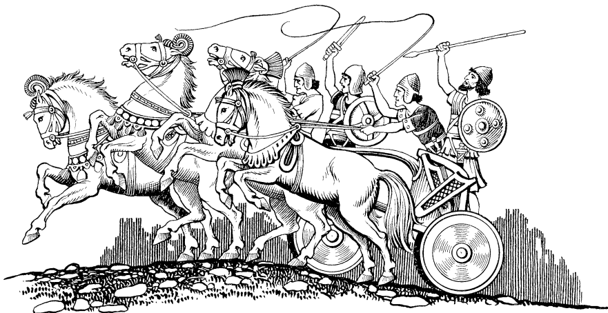
I' dör karreta tso' ñippoie ese. (Éxodo 14.6)

raë: 'Israel aleripa kè wà ijcher wé imi'mirö. Ie'pa cholurmi ká sir po, e' shuá. 4Erë ye' tó ie' er terawá darërë as ie' tó a' tótiümü. Ye' e' alöraká ie' kî ena inippökwakpa kôs kî, e' wa ye' dalöierdaë taië. Egiptowak ulitane wà ijcherdaë tó mokî ye' dör Jehová."