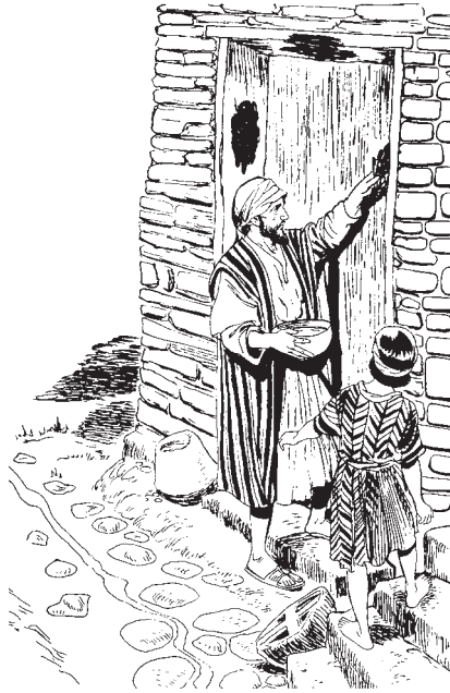
Casok' uquiq'uel bexex che ruchi' ja (Hebreos 11:28)

No'j e c'o jujun chic ticawex, ruma ri na xcaj taj cacok'otaj ri Dios, e xquicha' ri na xetzokpix ta chubi y ruc' c'u unimal c'axc'olil xecamic, ma e xquicha' ri jun chomilaj c'astajibal re c'aslemal na junta utakexic. 36 E c'o jujun chic lic xech'amixic, xjich' quipa, xeya'i' pa carena y xeya' pa cárcel. 37 E c'o ri lic