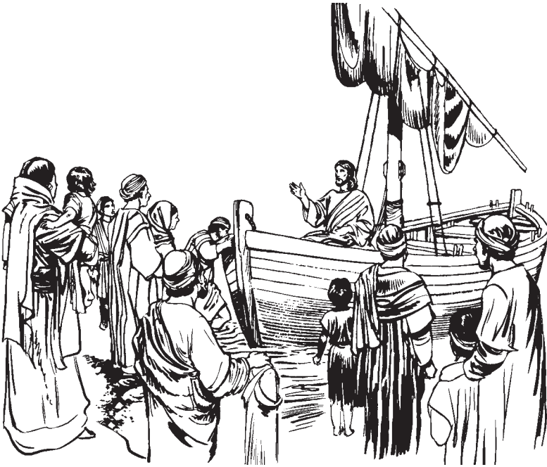
Taq ri winaq kakita ruk'utunik ri Jesús (Mateo 13:1-3; Marcos 4:1)

8 »No'j k'o ija' xtzaq kan pa chomilaj ulew. Ek'u ri' wa' xel loq, xk'iyik y lik xu'an reqa'n. K'o jujun raqan xuya treinta, jujun chik xuya sesenta y k'o ne xuya jun ciento» xcha'.