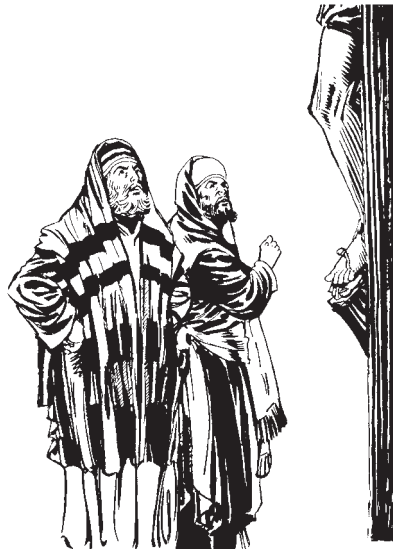
Ri e aj wach kakich'amij ri Jesús (Mateo 27:41-42; Marcos 15:31)

40 E k'o k'u jujun ixoqib' kakitzutza' pana chinimanaj. Chikixo'l wa' e k'o ri María ri aj Magdala, ri Salomé y ri María kichu ri Jacobo (ri más k'ak'al) y ri José. 41 Wa' wa ixoqib'