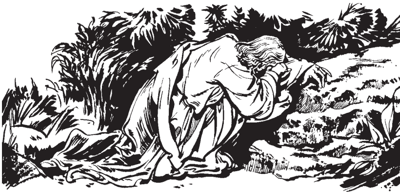
Ri Jesús ku'an orar pa ri werta Getsemaní (Mateo 26:36-46; Marcos 14:32-42; Lucas 22:39-46)

—K'o jun unimal b'is re kamik chinuk'u'x. Chixk'ola kan wara; mixwarik y lik chi'ana orar —xcha'.