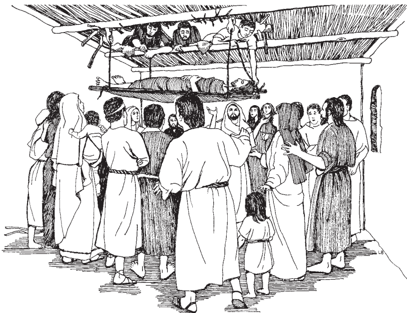
Rachijab' kakiqasaj lo jun sik chwach ri Jesús (Marcos 2:4)

12 Na jampatana xyaktaj rachi, xutelej b'i ruch'at y chikiwach konoje xel b'i. Konoje k'u ri' xkam kanima' che la xkilo y xkijeq kakiyak uq'ij ri Dios, jewa' kakib'i'ij: «iNa jinta k'ana qilom wi wa'!» kecha'.