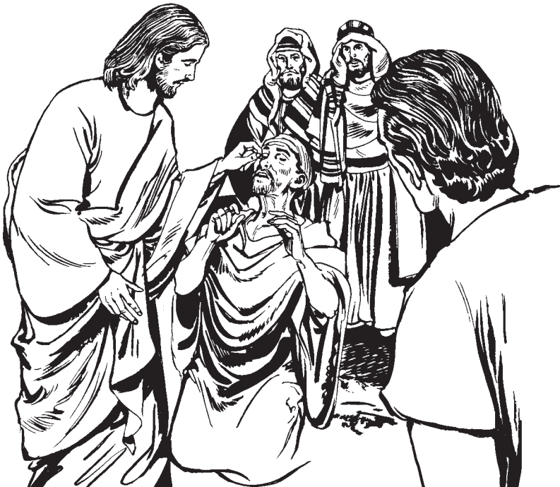
Ri Jesús kukunaj jun potz' (Marcos 8:22-26)

—Keb'enuwil rachijab' pacha' chi e che' keb'inik —xcha'.